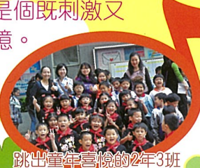
跳出童年喜悅的2年3班

三場比賽，激盪出大於三的迴響，這些學生們都一致認為：我們真幸運！能夠出來比賽，爭取展現自我的機會，是個既刺激又難忘的回憶。