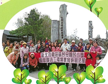
第三站-羅東林業文化園區