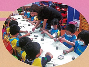
白兔班-好玩的陶土課