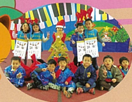
松鼠班慶生會耶誕老公公的幫手