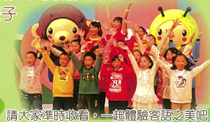
請大家準時收看，一起體驗客語之美吧