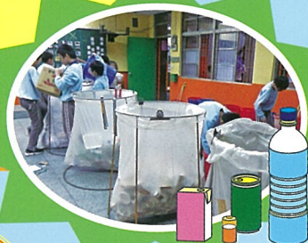
6年10班協助維護環保站，回收分類井然有序

【訓導處訊】「101年度垃圾減量、資源回收工作」實施績效績優，榮獲新北市政府環境保護局頒發3萬元資源回收專用獎勵金。