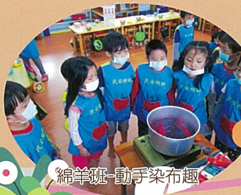
綿羊班-動手染布趣