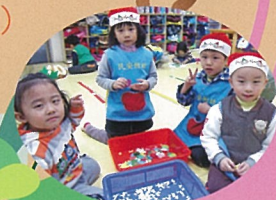
浣熊班-裝飾聖誕樹