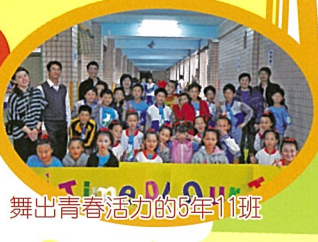
舞出青春活力的5年11班