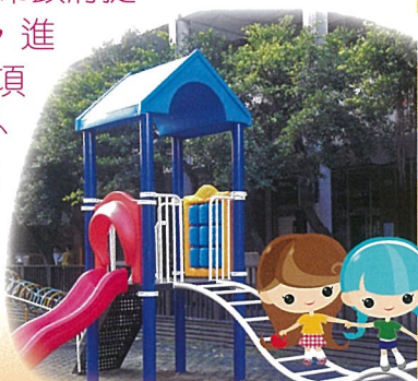
嶄新遊戲器材讓學生用起來快樂又安全

【總務處訊】感謝新北市政府提供本校各項經費補助，進行修繕工程、辦理各項活動及購置設備，另外感謝家長會爭取各級民意代表提供各項經費建議補助款，提供本校辦理各項活動及經費，也希望各位小朋友能知福惜福，好好的愛惜使用公物。