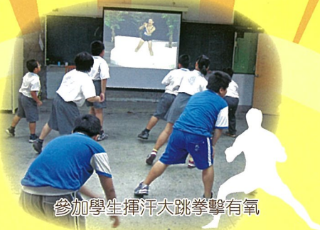
參加學生揮汗大跳拳擊有氧

【訓導處訊】101學年度減重班於10月9日開始，因考量下雨天的場地問題，今年採20人小班制。參加對象為中年級體位超重，並且有意願要參加減重的同學。課程設計多利用早自修的時間來增加他們一天的活動量，達到『多動』的目的。活動項目有健走、有氧拳擊、跳繩、呼拉圈…等等。參與學生均反應，一早做運動讓上課更有精神，看著體重逐日下降很有成就感。