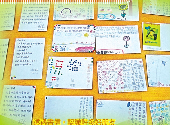
透過書信，認識許多好朋友

【輔導處訊】本校資源班今年與苗栗南庄國小資源班合作進行交筆友課程，期待透過寫信交友的方式，訓練孩子短文寫作的能力及教導孩子正確的交友方式與態度。在第一個單元「自我介紹」中，孩子為了讓筆友更了解自己，勢必要從不同的角度介紹自己，活動中不但提升孩子的詞彙量也加強孩子的「我」概念。此外，孩子為了讓筆友讀懂書信的內容，勢必得注意文章的流暢度，因此都能專心學習文章組織的技巧，活動中孩子不但不知不覺建立了寫作的能力，還會跟老師說：「原來寫文章這麼簡單喔！」