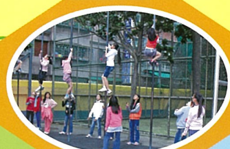
本校榮獲體適能績優學校