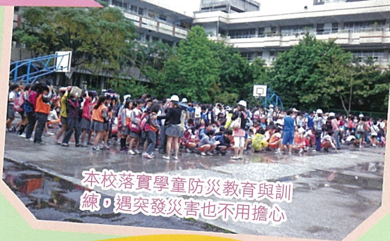
本校落實學童防災教育與訓練，遇突發災害也不用擔心

【學務處訊】鑑於臺灣地屬天災頻繁地區，防災教育的推動實屬重要，本校師生在防災總體計畫的編製、防災課程的推動、防災地圖的規劃、防災演練的實施等均全校師生積極參與，也獲得諸多肯定與佳績。本年度繼獲得新北市防災訪視評鑑特優第一名，近期又獲得教育部全國防災校園建置績優學校入選獎，相信在全校師生的努力下，本校防災教育的推動一定會更加優異。