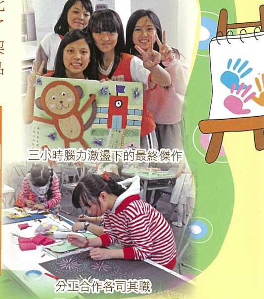
三小時腦力激盪下的最終傑作