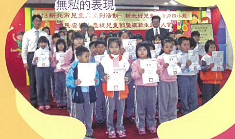
愛心小天使頒獎典禮