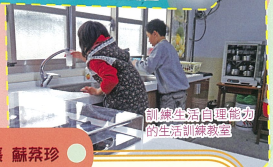
訓練生活自理能力的生活訓練教室