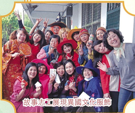
故事志工展現異國文化服飾

民安故事志工團成立於民國88年9月，目前團隊主要工作是每週四上午利用早自習時間7:50~8:30到校進班為學生說故事。故事志工們會利用遊戲、繪本、影片、美勞及音樂律動等多元化有趣的活動帶領孩子自然而然進入故事情境進而對故事人物情節產生共鳴。