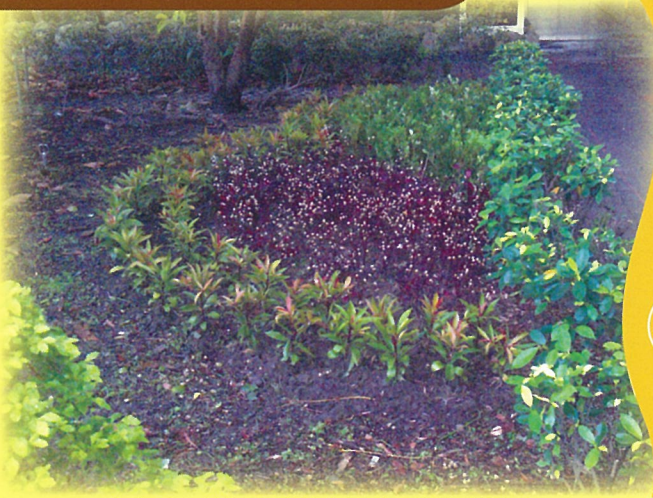
瞧瞧看，前操場綠美化新增了什麼植物？

【總務處訊】為營造優質學習環境，最近學校向新北市政府農業局綠美化景觀處申請2000餘株植栽，有春不老、鵝掌藤、射干、扶桑、女貞、紅龍、宮粉仙丹、杜鵑、擬美花、情人菊等十種，另外請專業園藝廠商搭配設計，將前操場綠美化得宛如公園一般。小朋友可以利用課餘時間，好好的觀察這些新嬌客（大部份為原本校園中沒有的），看看你可以認識幾種，但請勿攀折花木，要好好的珍惜這得來不易的環境，讓我們的校園永遠保持美麗。