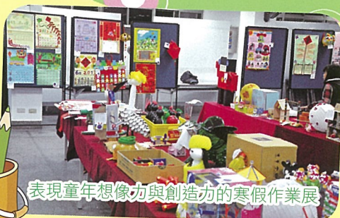
表現童年想像力與創造力的寒假作業展

【教務處訊】101學年度優秀寒假作業展共有132件獲獎，健康獎72件，力行獎48件，超越獎12件，豐沛的創意是民安學子們的優勢能力，而本校多元化的寒暑假作業提供學生恣意揮灑的天地，學生作品多樣化呈現，有立體的、有平面，有動物、有植物，有汽車、有輪船，琳瑯滿目，令人目不暇給，流連忘返，這些優秀的作品更是在家長日當天吸引眾多家長前來欣賞。