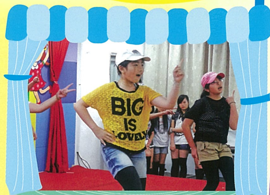
我最棒才藝表演，是小朋友可以展現多元才藝的舞台。

【學務處訊】本校近年固定舉辦的「跨年感恩惜福音樂會」及「兒童節自由表演」兩項活動，皆吸引眾多身懷絕佳舞藝與音樂長才的小朋友在舞台上大展身手，表演精彩深受學生與家長所喜愛。本校秉持多元展能適性揚才的精神，自3月29日起每個星期五早上在和平樓二樓大辦公室會定期舉辦「我最棒才藝表演」活動。以往音樂會與才藝表演偏重音樂與舞蹈二類，「我最棒才藝表演」則不限類別，舉凡相聲、朗誦、讀者劇場或話劇，只要你敢秀，通通都有在學校同學面前表演的機會。