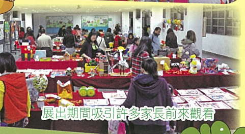
展出期間吸引許多家長前來觀看