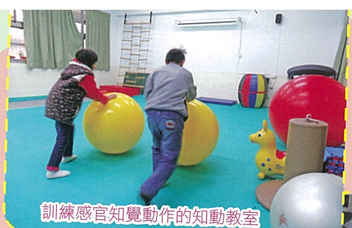
訓練感官知覺動作的知動教室

【輔導處訊】本校101年度獲教育局補助改善特教班班級設備及無障礙設施，已於101年度12月底完工啟用。本次整建工程的重點項目在於「無障礙廁所」、「生活訓練教室」、「知動教室」、「班級教室」的設備充實及改善工程。本案經特教班老師、學校行政以及專業人員的共同規劃，教育局給予經費挹注，讓本校特教學生擁有一個舒適、良好及設備完善的學習環境。