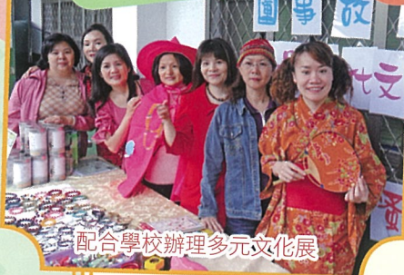
配合學校辦理多元文化展