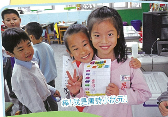
棒！我是唐詩小狀元！