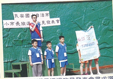
候選人與助選員透過政見發表會尋求選民支持