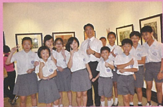
民安藝術教育有夠讚