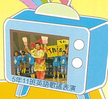
5年11班英語歌謠表演