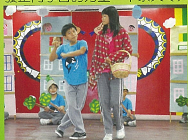
落落大方的演出，看不出只是小學生

本校向來重視藝術教育的扎根，發展多年的傳統-表演藝術，是其中一大主軸。中高年級學生經班級導師兩年的訓練，最後會在四、六年級辦理班級戲劇觀摩。班級戲劇觀摩由各班級任導師與學生們共同策畫，學生擔綱演出，不論是重現經典劇本、或是演出創意改編劇本，都看出師生對此課程的重視。小演員們的肢體動作精準到位，眉宇神情絲絲入扣。劇中使用的道具也是由各班的美術人才擔任道具組來精心製作，連演出時的背景音樂也絲毫不馬虎，串接得恰到好處，讓整個演出有畫龍點睛之效。感謝四六年級老師辛苦的指導，將美術、音樂、表演藝術三大主題之藝術教學成果透過班級戲劇觀摩畢其功於一役完美地呈現。讓學生有舞台展現其藝術潛能，班級間互相切磋欣賞，亦有助激發正向學習的力量，不禁又令人期待明年度的精采演出。