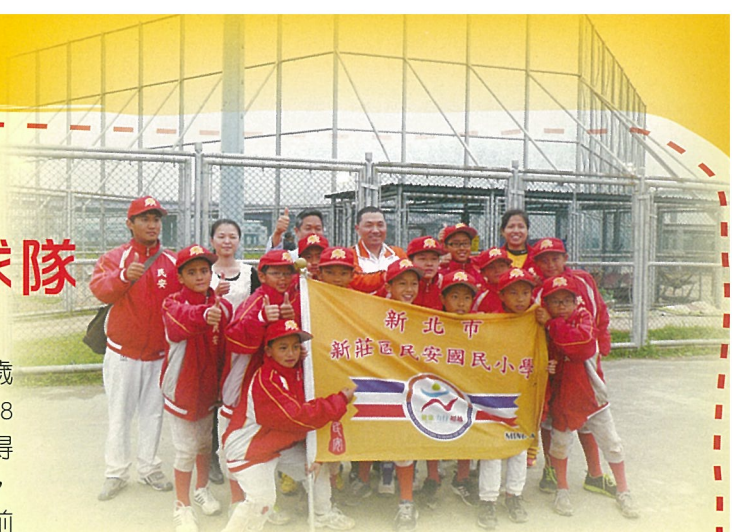
今年榮獲新北市棒球硬式組聯賽第二名及TOTO盃選拔賽第二名