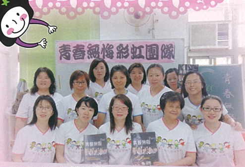
民安青春無悔課程團隊