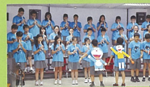
用直笛重新演繹經典卡通主題曲