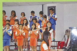
鋼琴、長笛與直笛的完美合奏

5月14-16日辦理四至六年級各班音樂教學成果發表，四年級是直笛齊奏，五年級是勁歌熱舞，六年級是直笛分部合奏，四六年級的直笛齊奏與合奏充分展現學生的音樂素養，勁歌熱舞則是洋溢著學生活潑的創意，由各班音樂科任老師所指導的成果展，是一場美麗的饗宴。