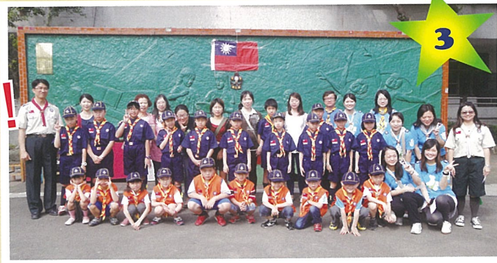
民安複式幼童軍第173團正式成立

有興趣加入我們的行列嗎？不要再猶豫了，馬上參加這世界性的青少年組織，也是聯合國NGO組織認可的教育性團體，我們滿懷熱情的等你喔！