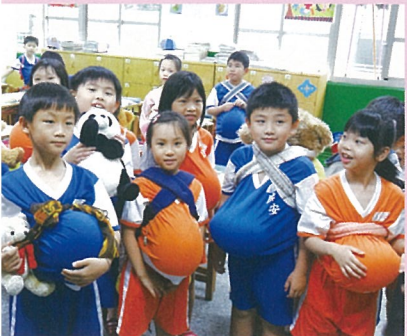
我是小媽媽-生命教育體驗