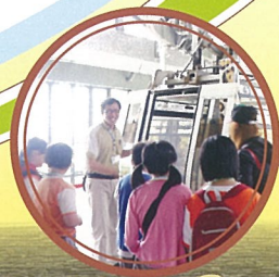
臺北市動物園 Taipei Zoo