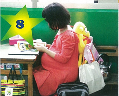
透過活動體會母親的辛勞