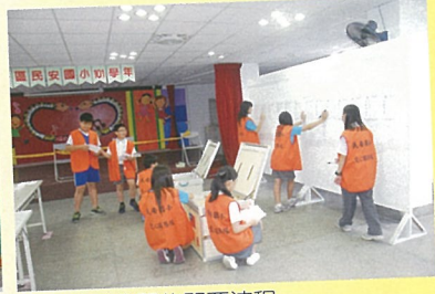
公平公正公開的開票流程