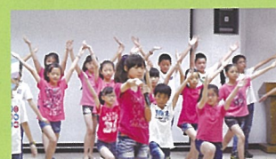
洋溢青春活力的勁歌熱舞