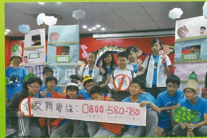
反霸凌宣導也被師生編入劇本