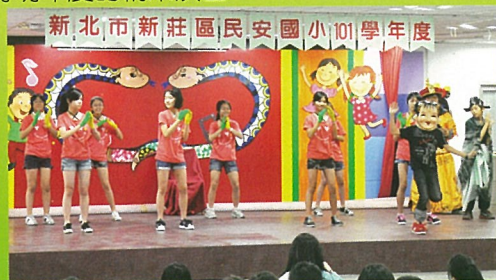
穿插舞蹈橋段讓戲劇更加活潑有看頭