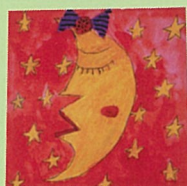
象徵女生的月亮圖案