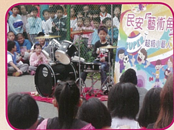
小藝人精彩演出吸引眾多學生觀賞

本活動以「做自己的英雄」為核心價值，並以同名曲為主題歌曲，引導學童聚焦「探索-築夢-實踐」，如歌詞意境：為自己燃燒過、奮鬥過、流淚過、揮灑過，做自己的英雄，相信改變就在此刻。校長也以學校願景「以健康的身心為學習奠基，以力行的決心展教育專業，以超越的熱情帶孩子築夢」期勉所有參與的小朋友，以最完美的狀態去迎接挑戰，為夢想放手一搏，點燃每個人心中的小宇宙，勇於做自己的英雄。