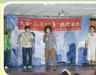
「永不放棄」戲劇演出

防制校園霸凌專線：22056777轉18 或撥打0800580780 紫錐花運動(反毒運動)網： http://enc.moe.edu.tw/index.php