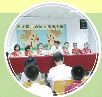
自治市討論思考 讓民安更好

自治市將推動事項如下：1.規劃學生意見反映管道或平台。2.結合自治市推動各班徵求捐贈愛心雨衣活動。3.舉辦棋藝比賽。4.規劃校園播放音樂、廣播說故事及午餐小DJ點播歌曲。5.如廁衛生習慣宣導活動。歡迎全校師生一起參與，讓創意政見能具體實踐。