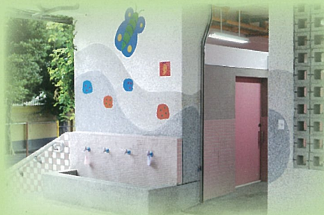
嶄新的廁所成為學生最喜愛的校園角落

本校即將要進行第三期及第四期廁所改善工程，希望為民安孩童打造一個更優質的學習環境，給我們的孩子有個快樂的童年。