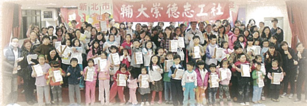
崇德親子讀經班堂堂邁入第十年

【輔導室訊】本校積極引進崇德志工社協助本校辦理「民安親子讀經班」，今年堂堂邁入第十年。崇德志工們利用每周五晚上的時間，到學校陪伴小朋友讀經，利用志工陪讀的力量，建立小朋友專注的習慣，不僅提高識字力，更培養其閱讀能力。並進而從讀經的過程中，來學習聖賢的人生智慧。另外，課程中也會穿插繪本故事及品格教育，讓小朋友學習的層面更