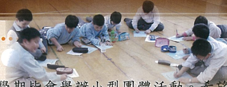
透過小记者活動認識新朋友

【輔導室訊】輔導室每學期皆會舉辦小型團體活動。希望透過小團體活動方式，幫助小朋友增進自我概念及人際關係；此外，藉由團體經驗的分享，使小朋友獲知共同情緒，學習發洩情緒的正當方法；協助學生坦誠面對自己，真摯關懷他人，進而達到自我成長與較好的適應。