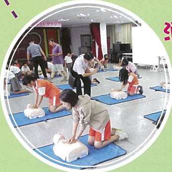
學生進行心肺復甦術CPR訓練

【學務處訊】本校於102年10月4日邀請輔仁大學附設醫院籌備處及福營消防分隊對學校五年級學生教授心肺復甦術CPR訓練。學生們藉由上課講解及實際操作演練CPR --- 叫(呼叫病患)、叫(指定一人叫救護車)、C(胸部按摩)、A(打開呼吸道)、B(人工呼吸)。同學們個個都認真專注的練習，期待學會後可發揮助人救人的勇氣。