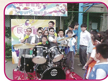
Super小藝人 英雄大聯盟