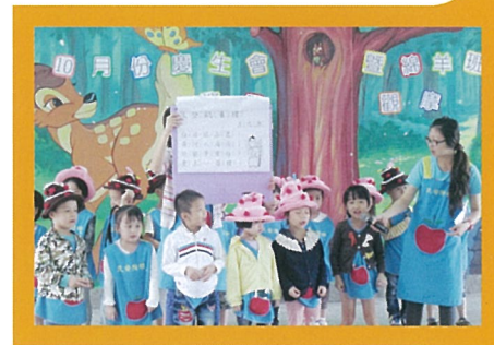
小壽星唐詩大挑戰

10月份慶生會全園進行了許多好玩的遊戲『小壽星唐詩大挑戰』、『猜猜我是誰』、『送我回家』及「健康活力GO律動」，小朋友們都很有團隊精神一起努力完成所有的關卡，很棒喔！10月16日是全園體能活動，綿羊班老師涵涵老師及小花老師帶領全園玩好多好玩的遊戲與律動，小朋友們充分地運用自己的大肌肉來活動並完成許多挑戰，活動中充滿熱情活力。