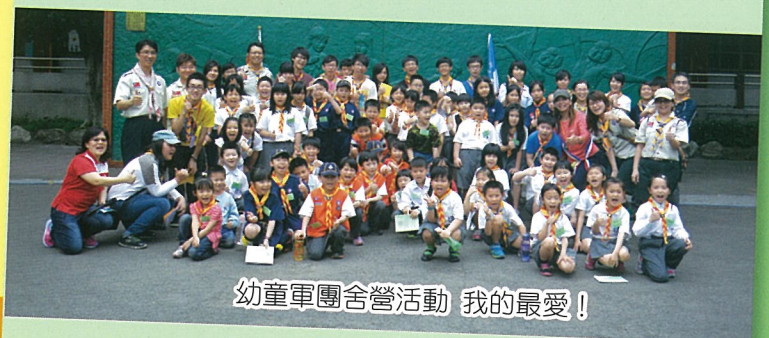
幼童軍團舍營活動 我的最愛！