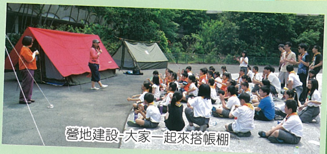
營地建設-大家一起來搭帳棚