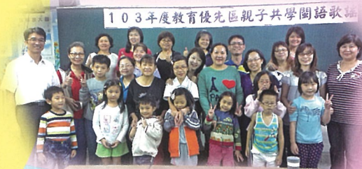
103年度教育優先區親子共學閩語歌謠