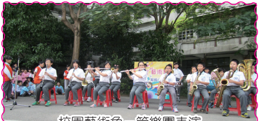
校園藝術角—管樂團表演