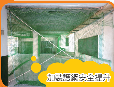
加裝護網安全提升

安全防護是推廣體育活動的首要條件，樂趣體驗則是建立運動參與的持續因素，希望民安喜歡運動的孩子們能在更安全的環境中成長，進而讓更多民安孩子因安全的運動環境開始參與運動、喜歡運動。