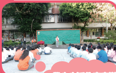
學生生活教育宣導

對照剛落幕的九合一選舉及縣市長宣誓就職，小朋友也可學習到「服務與責任」的真諦，小小民主的種子就在民安開始發芽成長！