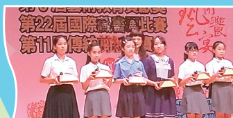
剪紙比賽-高年級受獎