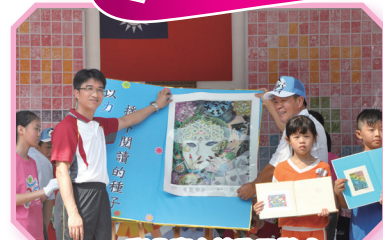
彩色魔方館啟用儀式