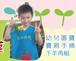
幼兒園寶實親手摘下羊角椒

【總務處訊】天空之城的菜與香料成熟了，其中菜中維生素C之王的羊角椒，幼兒園採收後，搭配雞柳清炒，肉質脆，甜而不辣；另外更利用天空之城採收的九層塔，做成三杯杏鮑菇、清炒肉片及蛤仔湯，為幼兒園營養午餐添加幸福小菜。