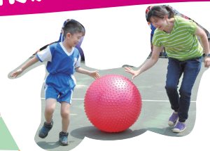
一年級親子趣味競賽

【學務處訊】5月7日是民安創校97週年校慶的大好日子，當天天氣特別晴朗、特別熱情，大家跟往常一樣心情愉快地迎接這天的到來。有別以往的是今年第一次邀請傑出校友團隊回娘家，當他們進場時，往昔的老師、教練看到當初培育出的幼苗在他校茁壯成長，不禁感到欣慰不已。此外，今年的校慶開幕式特別結合彩色魔方館的啟用典禮，也開放嶄新的彩色魔方館讓親子閱讀；前操場辦理感恩親子闖關家事體驗活動及公益團體的闖關活動，讓難得在校園共渡的親子能有更多元的互動及回憶；當天除了動態的活動外，在多功能藝廊也有靜態的親師生志工的藝術特展活動，讓整個校慶活動更為豐富、多元、有趣。