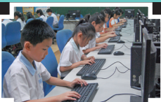
三年級中文打字比賽