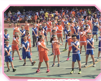
五年級健身操表演