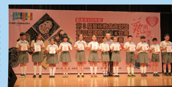
藏書票比賽-高年級受獎