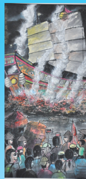
509 黃語涵·水墨畫·燒王船