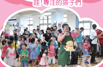
胖叔叔帶大家練功夫