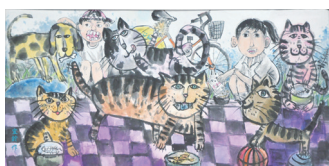
301黃宜鈴-水墨畫-我愛毛小孩

快樂的校外教學讓我學到了許多平常課本裡學不到的知識。真是獲益良多，讓人回味無窮啊！