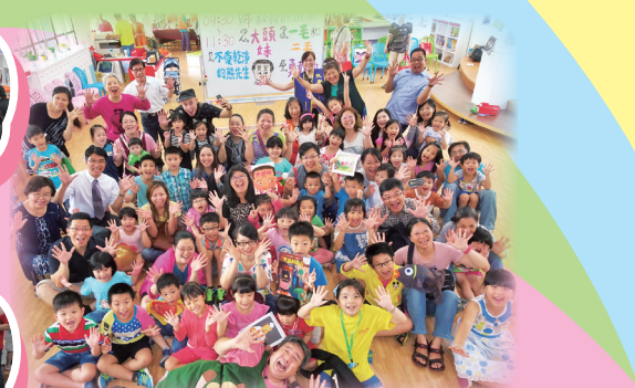
胖叔叔說故事 [不愛乾淨的熊先生+大頭妹+一毛和三毛+勇敢的錫兵]