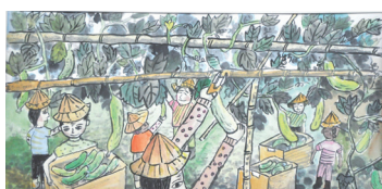
604董家甫-水墨畫-採瓜樂