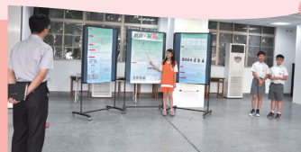
小小科學家實前解說