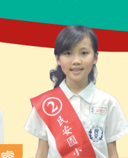
文化小局長郭嘉佳