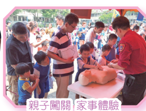
親子闖關 家事體驗