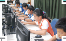
四年級各班選手專注的表情