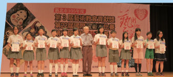
藏書票比賽-高年級受獎

【教務處訊】小小一枚藏書票，悄悄走進魔方館每本書的扉頁……。在彩色魔方館啟用之後，本校結合閱讀教育與校本藝術課程-藏書票版畫製作，讓每位學生創作出自己獨一無二的藏書票，並將這一張藏書票，貼在自己從魔方館借來的書的扉頁中，留下自己在民安國小的印記。一屆一屆學生接續完成，最後，所有四萬三千冊的館藏扉頁，都是民安每位學子所留下的情感。閱讀心，藏書情，愛惜民安的心，伴隨書頁永不熄。