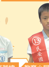
教育小局長蔡宗佑