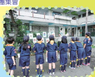
認識交通安全號誌