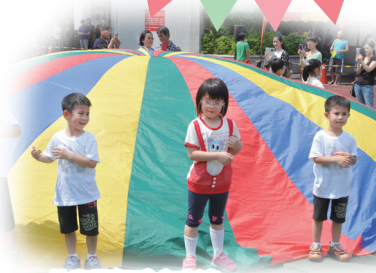
幼兒園氣球傘表演