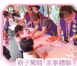
親子闖關 家事體驗