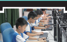
四年級文章打字比賽