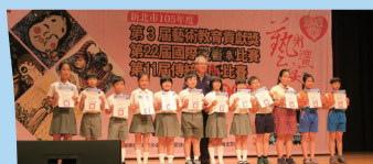
藏書票比賽-中年級受獎