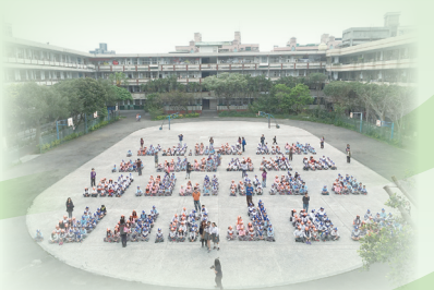
即將進行操場鋪面改善工程，期待嶄新安全的運動及學習環境

現已完成建築師徵選，並進行規劃設計，希望在暑假期間順利發包施工，期待開學後給親師生一個安全無障礙的學習及運動環境。