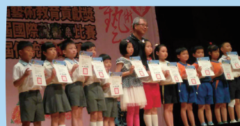
藏書票比賽-低年級受獎