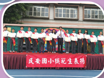
六年級模範生表揚