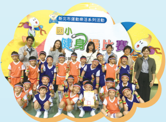
305 榮獲三年級組全市健身操冠軍