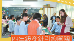
四年級穿針引線闖關