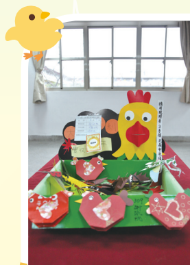
309 謝詠帆 大「雞大財」

【教務處訊】2017是丁酉年。酉是雞。丁是陰火，蠟燭，爐火，電燈之火。紅色屬火。酉屬金，故今年亦可稱為「金雞年」，在本次寒假作業，學生紛紛以金雞、火雞為主題，揮灑個自的創意，展現學習素養。教務處為了擴大家長瞭解與同學觀摩，已將得獎作品集放在學校相簿中，歡迎大家見證學校藝文教育之美。