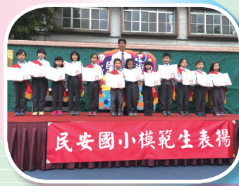
三年級模範生表揚