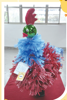
311 林泓宇 金雞報喜