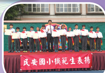
四年級模範生表揚