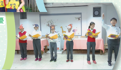
聲歷其境的讀者劇場 RT