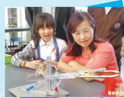
和局長一起玩科學