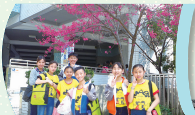
榮獲新北市西區特優

【教務處訊】聽、說、讀、寫，是英語的四大學習重點，教務處為培養同學英語朗讀及聽力，除於月考中增加英聽之外，更鼓勵參與英語讀者劇場，以生動的廣播劇，展現英語學習成效。本次502代表學校參加讀者劇場榮獲特優，將代表西區（新莊、淡水及三重）於4/28(五)參與市賽再創佳績，展露民安軟實力！