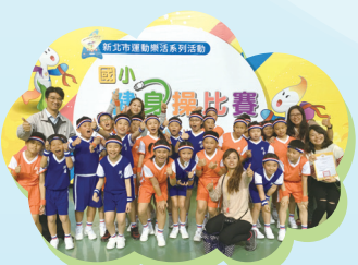
407 榮獲四年級組全市健身操第四名