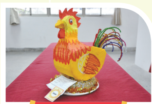
610 范姜德 金雞