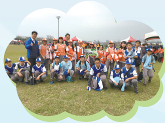
602 樂樂棒球賽 展現最佳團隊精神