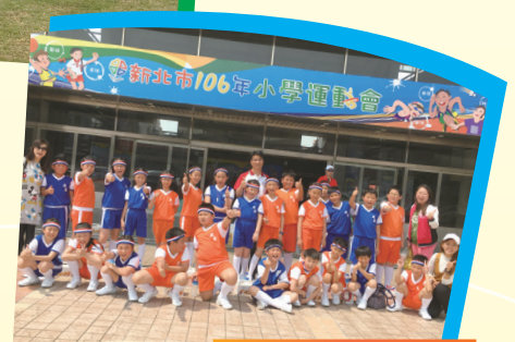
407 及 510 擔任 106 年國小運動會開幕表演