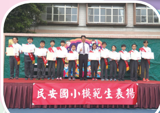
五年級模範生表揚