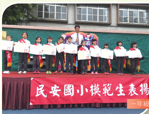
一年級模範生表揚