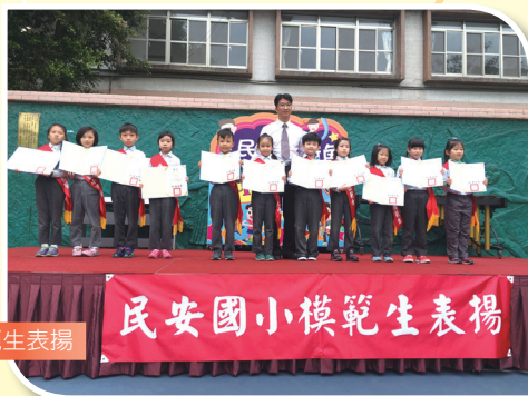
二年級模範生表揚