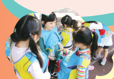
我的寶寶很可愛喔