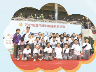
410 受邀新北市運動樂活記者會

【學務處訊】學校辦理的班際運動競賽已經蔓延在整個校園了，各班準備的過程中不但提升體適能，也增加團隊的合作精神，呼拉圈、跳繩、樂樂足球、樂樂棒球、大條繩、拔河等各式各樣趣味、安全的活動，都深受學生的喜愛，建立了校園運動風氣，並促進學生身心健康。透過參加各項2017新北市運動樂活系列活動，藉由參加比賽也讓學生充分的達到運動的效果，在練習過程中也養成了良好的品德，真是一舉數得啊！