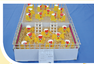
612 蔡竣巨 小雞樂園