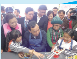
向市長講解液壓機械手臂

【輔導室訊】民安國小六年級42位學生參與福營國中「職業試探暨體驗教育中心」活動，當天由市長朱立倫主持揭牌典禮，孩子們與市長一起體驗職業類群—機械群、土木職群課程，親自組裝及操作機械手臂。每位學生都大呼有趣，透過這次的體驗活動，讓孩子對職業世界有更進一步的認識，也能從中瞭解自己的興趣及性向。