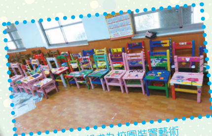
創意將成為校園裝置藝術

【教務處訊】創意源自於生活，而透過團隊合作彩繪廢棄的椅子，賦予它新的生命，更能體會「做中學、用中學、學中思」的道理。教務處從3/23（四）至4/6（四）在忠孝樓一樓走廊，辦理3-6年級創意美勞比賽，讓學子揮灑創意，大膽展現I世代的美學。