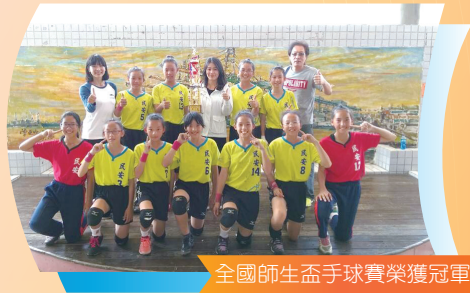
全國師生盃手球賽榮獲冠軍