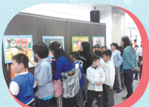
特教班學生欣賞畫作

【輔導室訊】106.2.20-106.2.21在民安藝廊辦理光點重症兒童巡迴畫展，藉由這個畫展讓學生可以了解生命與普特合教育的連結與重要性，這次參與的班級總共有48個班，大家一起聽志工老解說光點基金會的由來與這些小畫家他們是如何克服重重困難只為勾勒出一幅屬於自己的生命故事，這種精神實在令人佩服與感動。