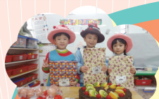
祝小壽星生日快樂

【幼兒園訊】每月舉辦的幼兒慶生會是寶貝們最期待的！老師們也藉由此時，讓孩子角色扮演，體驗懷孕並分享心情！寶貝們說：[肚子大大的，蹲不下去，穿不到鞋子啦！] 哈哈-這是孩子的體驗喔。可愛吧！