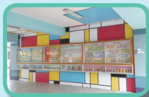
蒙德里安風格的格子彩繪