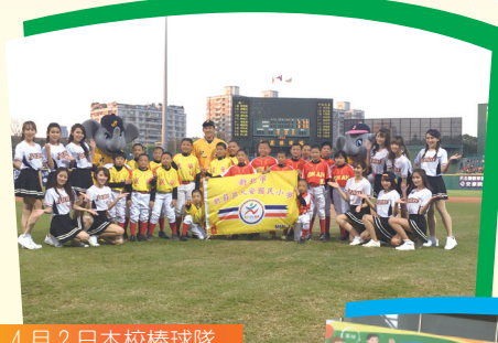
4 月 2 日本校棒球隊於中信兄弟賽前表演

⑨ 賀！本校六年級余嘉祐、張齊恩參加新北市 2017 國中小 scratch 程式設計競賽榮獲佳作！