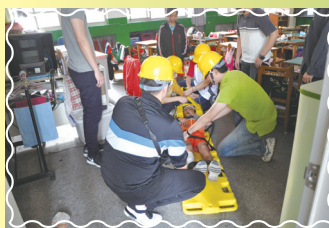
救護組搶救教室受傷學生

【學務處訊】台灣位於地震帶上，地震發生機率很高，必須提高警覺，做好萬全準備。學校會在每年3月及9月進行防災演練，另外還會在無預警情況下進行防災演練，就是要讓大家隨時有災害的應變能力。防災無訣竅，只有多一份準備，少一份災害，大家也要記得保命三要領-蹲下、掩護、穩住，並疏散至學校約定的地點後操場集合。