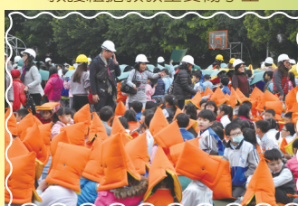
各班教師清點學生人數