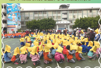
幼兒園及低、中、高年級學生集結至後操場情形