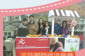
英語闖關情境餐廳