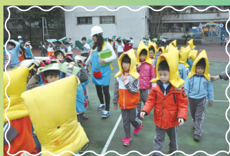
低年級及幼兒園同學疏散情形