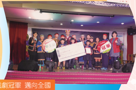
戲劇冠軍 邁向全國