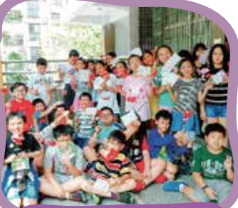
手持花與卡片表達愛與感謝