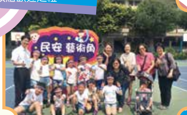
二年8班小藝人与來賓合影