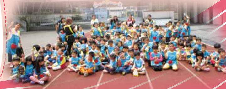
全園 40M 賽跑合照