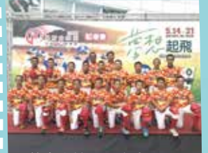
華南金控盃記者會合影