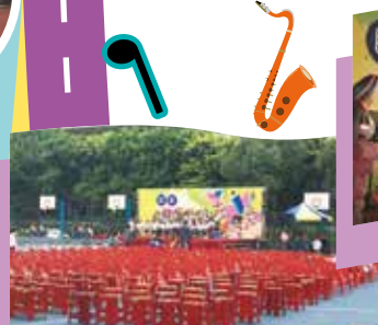
校園室外藝術中心

【學務處訊】有別於以往的民安仲夏樂社團成果發表會在嶄新亮麗的前操場演出，場地佈置後頓時讓校園變成室外藝術中心，當天的節目演出精采絕倫，除了學校的特色社團管樂 A、B、C 團、合唱團、太鼓社團、舞蹈社團、英語讀者劇場、原住民戲劇表演外，還邀請鄰近千暉、成德幼兒園一起參與演出，觀眾席排放八百張的座位是座無虛席，還有很多觀眾是以站票欣賞演出的，可想而知節目的精采度。