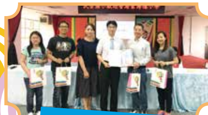
民安致贈歡迎之禮

【教務處訊】把世界帶進教室，讓民安學子能參與「台—港教育交流」，接待聖博德小學的貴賓。由自治市小市長以中英雙語歡迎來訪的師生、與602同學進行樂樂棒友誼賽、欣賞民安小藝人的丰采、參觀天空之城……。最後壓軸的是林淑期老師的「台語真趣味」教學。在交流過程中不僅展現民安學子的學習素養，更讓國際交流這樣好玩的課程走進課堂，創造雙方學生豐盛的學習體驗，更讓來訪的師生對本校讚賞有加。