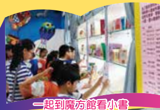
一起到魔方館看小書

【教務處訊】藏書票（EX-LIBRIS）可以說是一種小型的版畫，是用來貼在書本封面內側，作為自己藏書的標誌。民安作為新北市藝文深耕學校，不斷致力開展藏書票課程，更進一步讓藝術與閱讀結合，在六月畢業前夕，學校舉辦「民安藏書票ING」活動，由美勞老師帶領一到六年級的學生，將自己創作的藏書票貼入彩色魔方館的書籍中，並在六月十四日舉辦藏書票評選活動，更在畢業留言板上，以六年級各班學生的藏書票作為裝飾，留下更多美好的回憶。