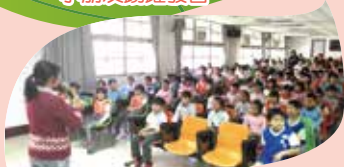
小朋友認真聆聽宣講