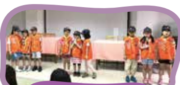
幼兒園帶來的超萌祝福