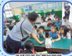
老師回答我們的問題