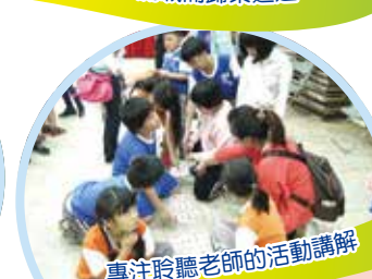
專注聆聽老師的活動講解