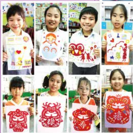
現代與傳統剪紙作品