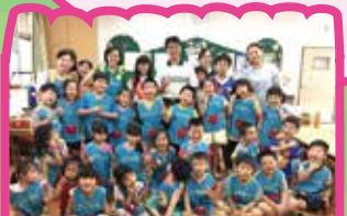
謝謝校長和會長送老師母親節花朵