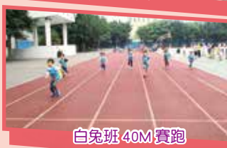
白兔班 40M 賽跑