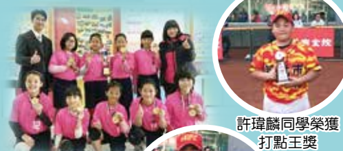
四年級手球隊獲傳承盃全國冠軍