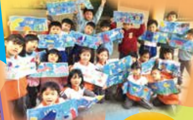
跟我們「藝」起閱讀吧!