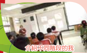
介紹不同階段的我

【輔導室訊】這學期輔導室辦理學生宣講活動，以「生命教育」為主題，透過「人的一生」短片欣賞，引起孩子對人生的初步認識，利用圖片來連結到人生面臨的四個重要階段——生、老、病、死，介紹各階段的過程與意涵；與孩子透過「小蟋蟀」繪本的閱讀、分享與討論，讓孩子了解生物與大自然的關係，能愛護小昆蟲，了解保護小昆蟲的重要性與具體作法，藉由接近自然，關懷自然與生命，進一步讓孩子體會生命的意義及存在的價值，進而培養尊重和珍惜自己與他人生命的情懷。看見一年級小朋友們認真投入、熱烈的參與活動，相信對生命意涵有更多的探索與學習！