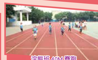
浣熊班 40M 賽跑