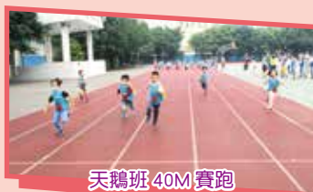
天鵝班 40M 賽跑

【幼兒園訊】小朋友們平日的跑步練習成果在四十公尺賽跑中呈現嘍！我跑，我跑，我跑跑跑！嘿～嘿～追不上我吧！別小看我呢！短跑健將非我莫屬。加油！