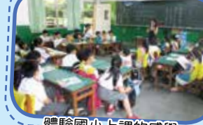
體驗國小上課的感覺