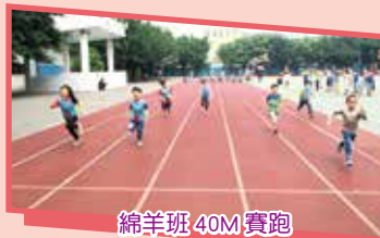
綿羊班 40M 賽跑