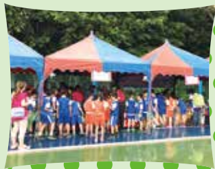
多元闖關體驗學習