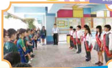
自治市幹部迎接香港來賓