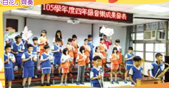
徜徉在悠揚樂音中