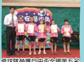
桌球隊榮獲自由盃全國第五名