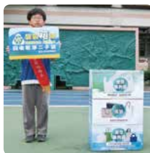
環保小局長宣導 reBAG3.0 袋袋箱傳計畫

【學務處訊】近年來塑膠垃圾所造成的海洋汙染問題日益嚴峻，海洋生物誤食塑膠而喪命的事件也日益頻仍，像是民國 104 年十月於八掌溪出海口死亡的抹香鯨，解剖後發現胃裡滿滿都是塑膠垃圾，海龜也常錯把塑膠袋當作水母吃下肚，連死去的信天翁幼鳥肚子裡也滿滿都是塑膠。人類為圖方便，大量使用「一次性」的塑膠製品，使得從陸地到海洋，處處都是塑膠垃圾。有鑑於此，為解決塑膠袋濫用的問題，新北市環保局決定將源頭減塑之概念從校園扎根，發起 reBAG3.0 袋袋「箱」傳計畫，並在有申請環保小局長計畫的校園中設置閒置袋子活化共享平台，收集師生用過的環保購物袋、紙袋及塑膠袋循環再利用，期望能透過垃圾源頭減量及資源循環再利用，來保護我們的環境。目前 reBAG 袋袋箱傳回收箱已放置在本校的環保教育站內，本校師生可善加利用。