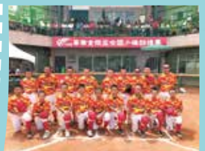
棒球隊榮獲華南金控盃全國第四名