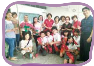
自治市幹部來獻花囉！