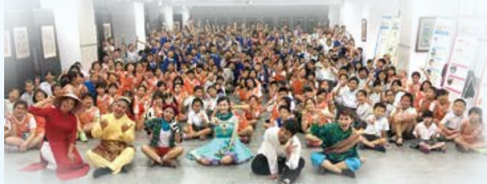
多元文化戲劇宣導

因此，輔導室特地邀請六藝劇團演出《航向希望》劇碼，跟著主角小夫一同尋找航海的夥伴們！這是由新北市勞工局委託辦理的計畫，希望透過活潑的戲劇，將越南、泰國、印尼、菲律賓等國的飲食、生活、宗教、習俗多元文化內容融入戲劇當中，讓孩子們能進一步認識東南亞國家的文化，建立對多元文化正確的認知，尊重不一樣的文化。