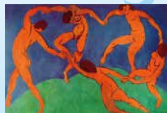
舞者二 (Dance II)，1909。油彩、畫布，260 x 391 cm。俄羅斯聖彼得堡艾米塔吉博物館

馬諦斯的老師曾對他說：「亨利，你是為簡化繪畫而生的。」馬諦斯以簡潔的線條描繪五位舞者手拉著手圍成一個圓圈，開心地跳著舞，充分展現舞者的自由揮灑的肢體動態，讓我們感受到生命的活力和喜悅。這幅畫只用了藍、綠、紅、褐，四種顏色。民安國小也有一幅馬諦斯的「舞蹈」喔！你發現了嗎？趕快找一找吧！