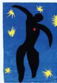
伊卡洛斯 (Icarus from Jazz)，1946。水粉、剪粘、紙，43.4 x 34.1 cm。法國巴黎龐畢度藝術文化中心

這是馬諦斯1947年晚期的剪紙藝術作品，畫面中的人物是希臘神話故事中的伊卡洛斯，他是希臘神話中的人物，他和父親被關在迷宮裡高高的塔樓，為了逃出。以蠟結合鳥羽製成翅膀，父親告誡兒子，飛行過高，會因強烈陽光的高熱灼燒，造成蠟翼融化。但伊卡飛上天後卻忘了父親告訴他的忠告，最終墜海溺斃。