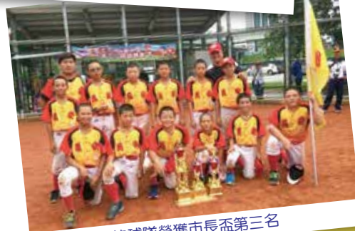
棒球隊榮獲市長盃第三名