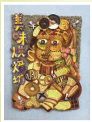
106 學年度全國學生美展 新北市西區平面設計 第三名 610 陳凱昀