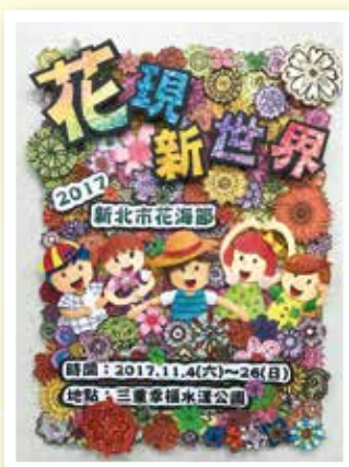
106 學年度全國學生美展 新北市西區平面設計 第三名 502 胡語真