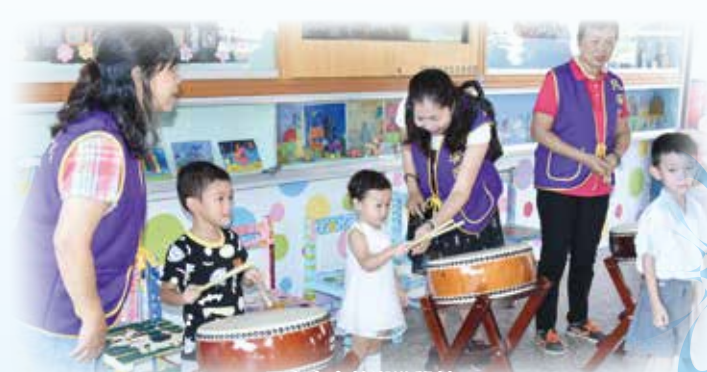
民安寶實敲響勤學鼓

【輔導室訊】8月26日星期六的一大早，校長、會長與吉胖喵一同出現在民安國小的校門口，迎接民安寶貝們的第一天上學，在志工們的協助下，小一新生們走過啟迪智慧的拱門、敲響勇氣的鐘聲、打擊勤學之鼓，除了開啟孩子們的智慧外，更期許能有好學不倦和勇於面對的精神，迎接國小的生活。校長與會長也贈送文昌糕與乖乖桶，祝福每位民安寶貝們都能有個快樂又充實的國小生涯，並且學習健康、力行、超越的精神，在民安國小內茁壯成長。