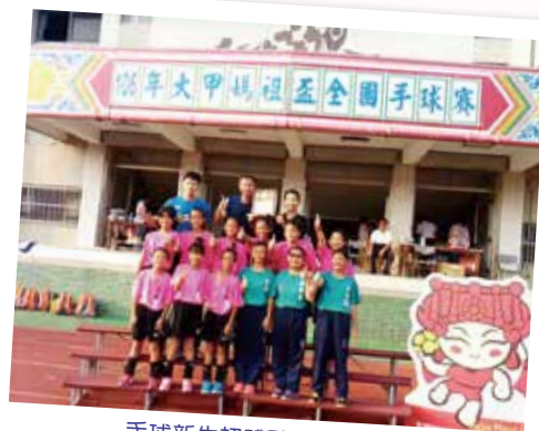
手球新生初體驗 - 媽祖盃冠軍

【學務處訊】酷熱的暑假你在做什麼？二個月漫長的暑假正是各個體育團隊的鍛鍊期，他們犧牲暑假假期，放棄在室內舒服的吹冷氣，勇敢、堅持地在太陽下接受專業、嚴格的基本訓練，為的就是能突破自己，踏上自信的舞台，享受、體驗和別人不一樣的童年，培養堅持到底，直到夢想到手的運動精神，也是奠定未來待人處事的態度。