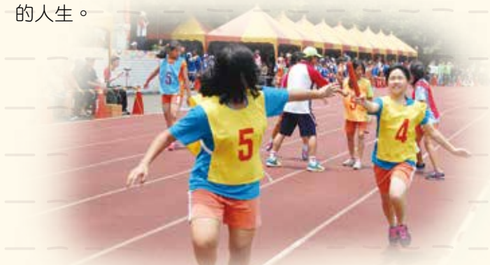
大隊接力 - 學會團隊合作的精神

我覺得不能讓別人來決定你的人生，所以我會想盡辦法來讓我的人生變得多彩多姿，將來我也能豐富別人的人生。