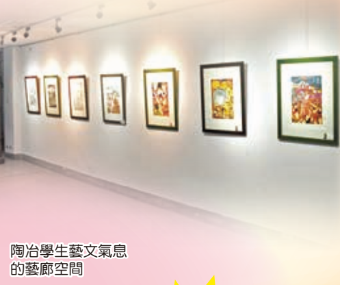
陶冶學生藝文氣息 的藝廊空間