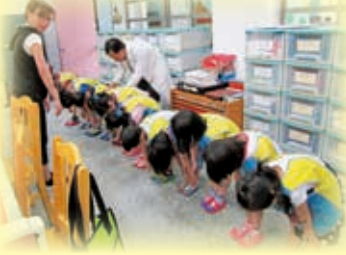
幼兒園健康檢查-脊椎檢查

【幼兒園園訊】為了孩子的健康新莊衛生所來園所幫就讀中班孩子做身體健康檢查，此次檢查增加「尿液檢查」及「腰圍量測」兩個項目，若檢查結果異常醫師會開轉介單，請到醫院做更進一步的檢查及治療，一起維護孩子的健康。