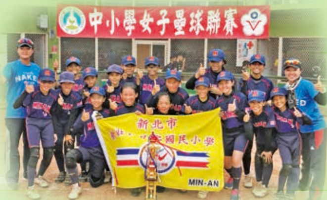
106 學年度中小學女子壘球聯賽全國冠軍