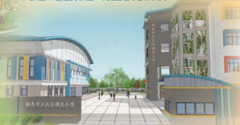
►改建後視野開闊的民安大門