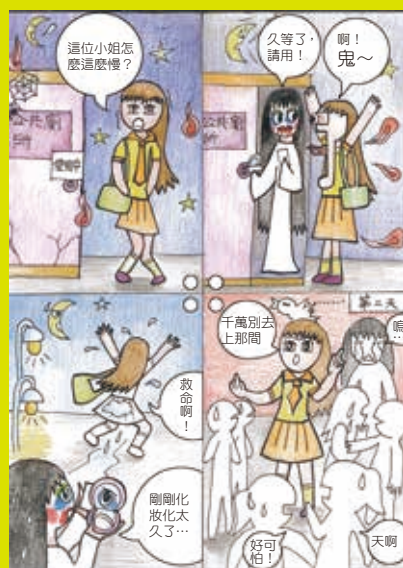
410 傅宇禎 都是化妝惹的禍

蟬的話語偷偷的告訴我們回憶該如何保存呢？回憶就像一顆果實，有些是甜美的，有些是苦澀的，也有些是破碎的。我們不須感傷，收起淚水，一起往前。再見老師、同學，再見民安，祝我們 畢業快樂。