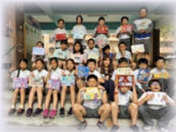
六年級玩小書 畢業小書

「藝起玩小書」活動結合語文及藝文領域，各年級依照主題和樣式的不同，創造出令人讚嘆的小書作品，在4月23日這一天，全校一同展出作品，互相欣賞文字與圖畫結合的小書之美。