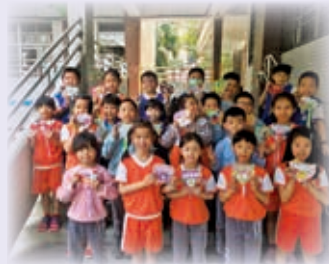
二年級玩小書 最珍貴的禮物