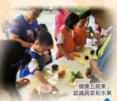
「健康五蔬果」 認識蔬菜和水果