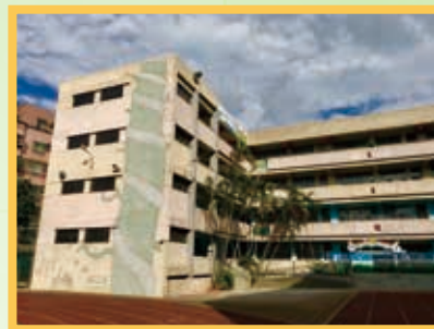
補強後煥然一新的至善樓

雖然在改建工程的期間，難免造成校園環境及動線上的不便，但我們能一同期待改建後全新完善的校園，見證百年的民安國小璀璨新生。