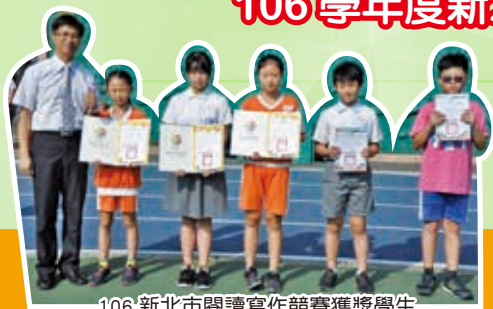
106 新北市閱讀寫作競賽獲獎學生