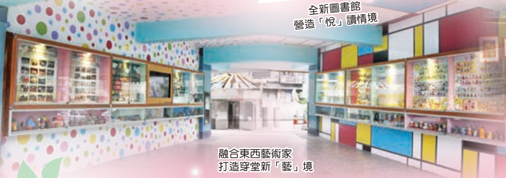
融合東西藝術家 打造穿堂新「藝」境

教育是百年大計，為持續營造優質學習環境，近年積極完成各棟教學大樓整修、改造全新圖書館及亮麗前操場等，也將於今年全面更新後操場鋪面及遊戲區等，打造涵養人文藝術的美感情境及孩子喜愛的活力校園。