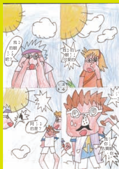
208 嚴亮棋 新眼鏡