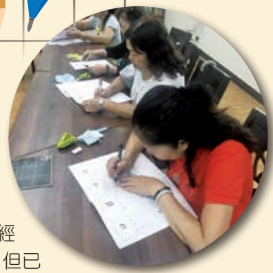
志工認真寫字的模樣