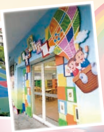
全新圖書館 營造「悅」讀情境