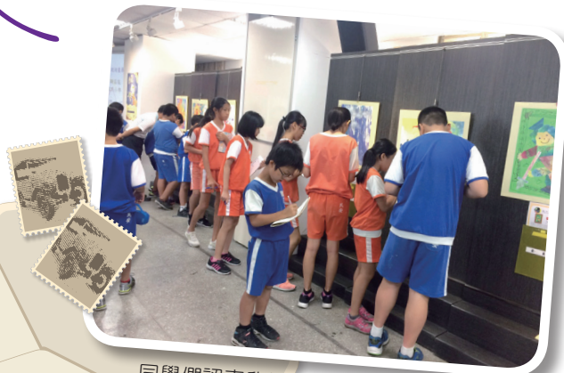
同學們認真欣賞畫作並寫下祝福小卡