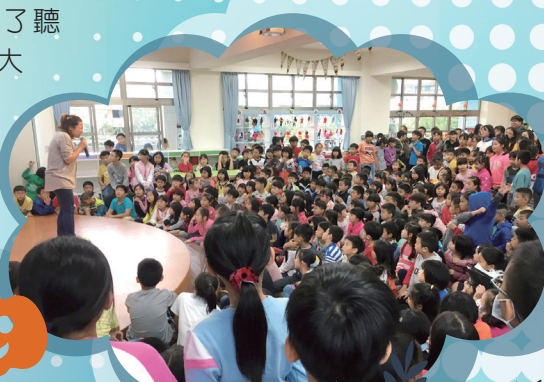
同學們認真的聽著大魔王說故事