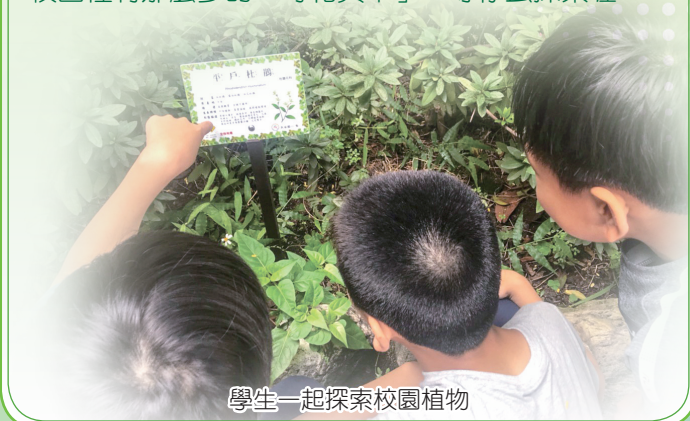
學生一起探索校園植物

【學務處訊】您有注意到最近校園的植物都有了專屬名牌嗎？上面有詳細的植物介紹以及圖片。另外，在 10 月 24 日學校也舉辦了環境教育研習，由原生植物協會的呂文賓理事長親自來為我們講解校園植物，「一花一世界，一葉一如來」，每個植物都有滿滿的故事可以分享。像是桑樹，其實有多種用途，有酸甜的果實可製成桑椹果醬；還有樹皮可作為造紙的原料；更別說葉子是蠶寶寶的最愛。平常看到小小一朵大花咸豐草的花，原來是五十幾朵花組合而成的。校園裡有那麼多的「奇花異草」，等你去探索喔！