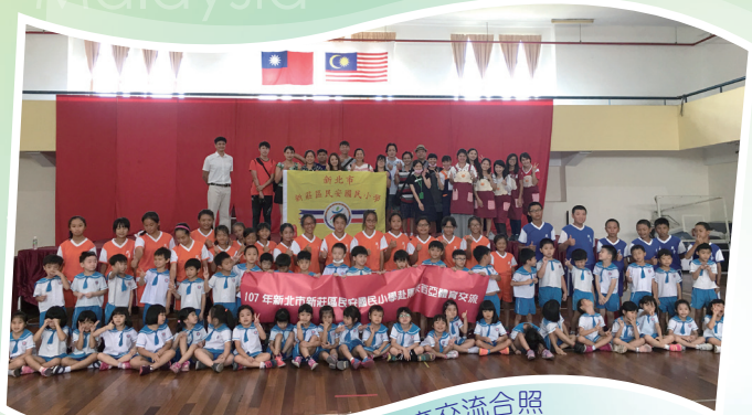
吉隆坡臺灣學校體育交流合照

【學務處訊】今年的暑假，體育班在辛苦的練球之餘，前往了馬來西亞進行交流之旅，大家對於能一起出國都感到非常的開心。這趟行程的重頭戲就是與吉隆坡當地的臺灣學校進行體育交流，除了參觀學校內的體育設施外，同學們也一起指導了當地的學生打樂樂棒球，渡過了一個充實的上午。同學們也利用這次難得的出國機會，參觀了當地的粉紅清真寺、到黑風洞看猴子，品嚐當地的的美食燕窩及榴槤。這趟國民外交之旅，對體育班同學來說真是既可貴又難忘的回憶呀！