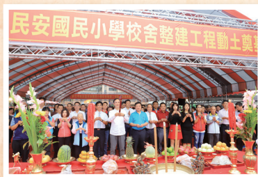
市長率領全體嘉賓為動土典禮祝禱