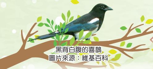
黑背白腹的喜鵲

喜歡在早晨，將你們送進民安國小， 快快樂樂上學去，與同學師長學習； 喜歡在傍晚，將你們送回溫暖的家， 平平安安返家去，與朋友家人分享。 我是守護民安國小孩童安全的最佳使者！