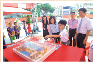
自治市小市長為局長介紹新校舍模型

本次校舍整建工程由新北市政府編列5億4,124萬元之經費，委由新北市政府新建工程處以統包方式代辦，預計新建一棟地上四層教學大樓含40間教室、一棟地上三層體育館，以及地下室二層共構交通局停車場。工程分為兩階段，第一階段（教學大樓、體育館及地下室停車場等）工期預定800個日曆天，預計於109年5月間竣工；第二階段（拆除忠孝樓及營造生態池景觀區）工期預定為180個日曆天，全案預計於110年3月前完成。未來，新建校舍啟用之後，學校將擁有設備完善的教學教室、視聽教室、永續多樣性的生態池教學區、以及提供體育教學發展與社區運動的多功能體育館（活動中心），讓教育與校務有更前瞻的經營與發展；而地下二層停車場興建竣工後，將提供214個汽車位及50個機車位，以舒緩社區長期停車空間不足的問題。改建後更是活絡學子及社區民眾學習與休閒生活的友善校園。