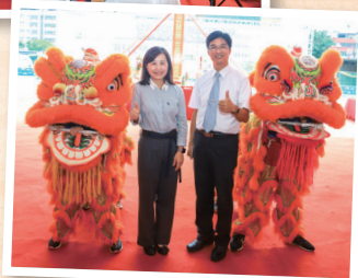
興福國小醒獅團與局長校長合影