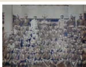
日治時期的學生合照