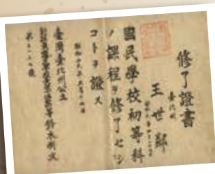
日治時期畢業證書