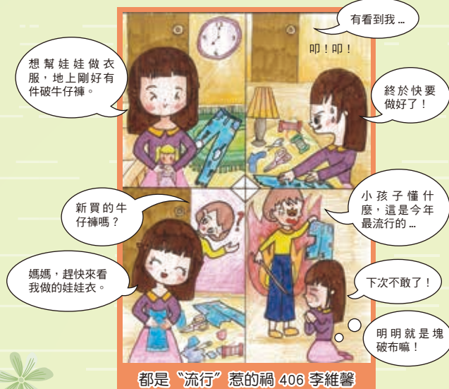
都是『流行』惹的禍 406 李維馨