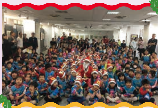
幼兒園和最愛的聖誕老公公合照

【幼兒園訊】小朋友最期待的一年一度聖誕節活動來臨囉！當天有精彩的魔術表演及親子蛋糕DIY，還有最重要的 - 每年校長都和我們一同歡樂慶祝，由校長扮演的聖誕老公公贈送小朋友聖誕禮物！今年的聖誕節除了讓小朋友們感受到濃濃節慶，也滿足了小朋友們對聖誕節的期待，同時還多了神奇魔幻與親子同樂的歡樂氣氛，大家都很开心與滿意！