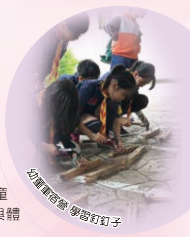
幼童軍宿營 學習釘釘子

兩天的活動，孩子們在交流中成長，在活動中求進步。這兩天，民安幼童軍的表現可圈可點，不但獲得六面榮譽錦旗，更重要的是他們所得到的收穫是無價的，期許每一位幼童軍都能秉持一日為童軍，終身為童軍的信念，遵守童軍諾言及規律，繼續在「服務」中學習成長。