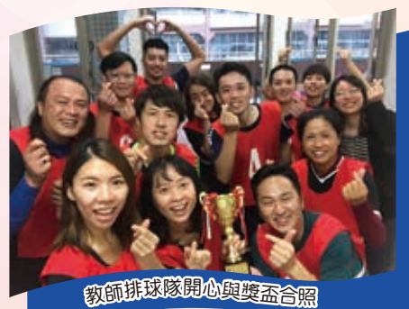
教師排球隊開心與獎盃合照

【學務處訊】教職員工排球錦標賽是新北市政府一年一度的盛大體育賽事，今年共有 12 支隊伍參賽，參與競賽的全都是新北市各級學校的教職員工。民安國小在第一場比賽中旗開得勝，對戰榮富國小隊以 2：0 順利拿下。緊接著第二場遇上中平國中隊，再度乘勝追擊奪下第二勝，以分組第 1 名之姿順利晉級複賽。下午，複賽第一場遇上了勁敵海山高中隊，開賽首局就遇上亂流，以 3 分的差距飲恨。不過第二局一開始，場上的 9 位選手立即回穩，發揮平時水準，最後上演 2：1 逆轉勝，晉級到四強賽。無奈在四強賽遇上傳統強隊後埔國小，選手們個個放手一搏、背水一戰，可惜最終仍不敵對手，與安坑國小並列第 3 名。今年的比賽，刷新了隊史上的新紀錄！大家攜手相約明年再一起參賽，再創佳績！