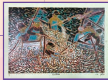
107 學年度全國學生美展 版畫類佳作 607 李瑋翎

本校教師參加新北市 107 學年度中小學教職員排球賽榮獲第三名！參賽教師：劉俊輝主任、劉美玲主任、江志宏組長、蔡宗翰組長、張哲銘老師、梁仲銘老師、洪詒志老師、陳宜歆老師、廖冠萍老師、林姿君老師、葉人瑜老師