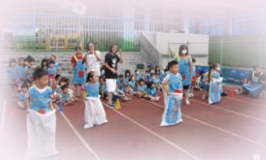
幼兒園全園體能活動 - 袋鼠跳跳跳