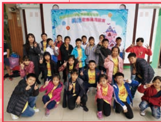
503 榮獲新北市 107 學年度西區英語歌曲演唱比賽優等