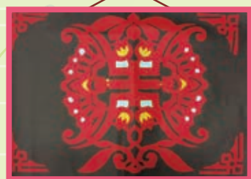
福壽綿長 -102 朱敏菲