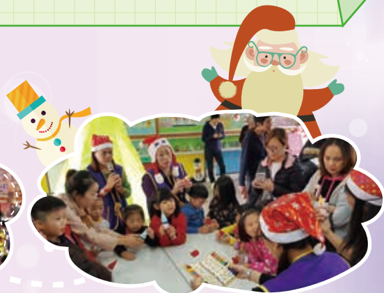
聖誕故事派 親子動手做