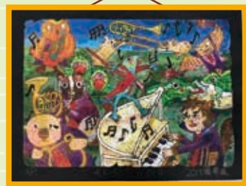
107 學年度全國學生美展 版畫類佳作 403 李金鴻

這次的童軍聯團活動，我學到了如何使用鐵槌、鋸子、打出常用的童軍繩結.....也學會許多耳熟能詳的童軍歌曲。在老狼們活力帶領之下，我們發揮團隊合作的精神獲得了「六面」榮譽旗。感謝小玉老狼、蒼茜老狼、瀚陽老狼和麗燕老狼的帶領，也感謝校長在出發前給我們的鼓勵。這次的活動意猶未盡，大家相約幼童軍聯團宿營，明年再見！