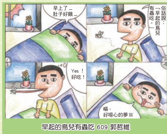
早起的鳥兒有蟲吃 609 郭哲維