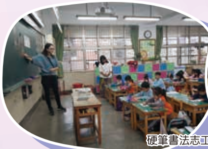
硬筆書法志工入班教學