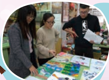
百年校慶意象圖案徵稿評選