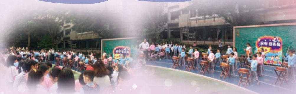
民安藝術角 Super 小藝人活動