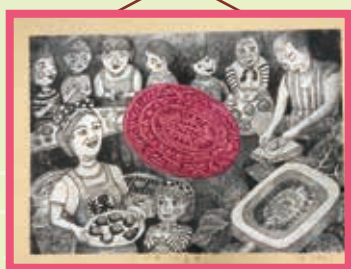
107 學年度全國學生美展 版畫類佳作 510 王梓亘