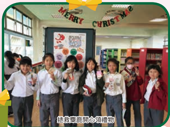
拯救馴鹿開心領禮物

【教務處訊】下課時間，小朋友在忙什麼？原來大家要去拯救馴鹿，彩色魔方館的馴鹿失蹤了！聖誕老公公很著急，因為沒有馴鹿，聖誕老公公無法發送禮物給小朋友，馴鹿在學校各處的漂書站留下線索，小朋友依照順序找出馴鹿提示的內容，將內容依序寫下來，且從漂書站中挑一本喜歡的書籍閱讀，並寫下書名和作者，就能向聖誕老公公兌換小禮物。