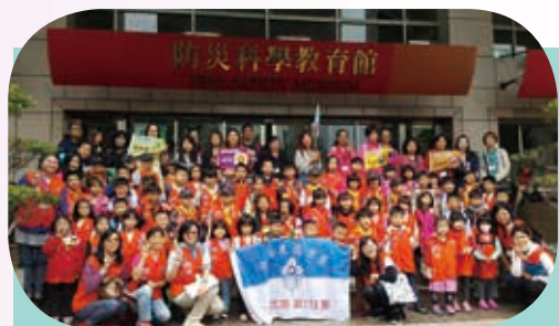
稚齡童軍校外教學 - 防災科學教育館

【幼兒園訊】這次稚齡童軍團集會活動，我們來到了臺北防災科學教育館喔！透過現場專業的導覽人員介紹與實際的防災體驗活動，提供了狼寶寶多元學習能力的機會與知識，並增進團體間的情誼，同時寓教於樂培養孩子最重要的能力 - 解決問題與勇氣；期許藉由每一次的稚齡童軍團集會活動，幫助到狼寶寶學習成長。