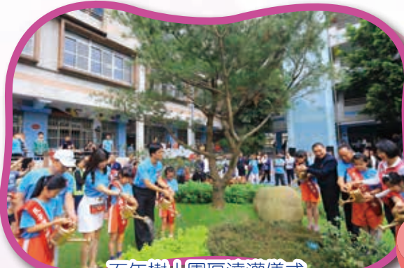
百年樹人園區澆灌儀式