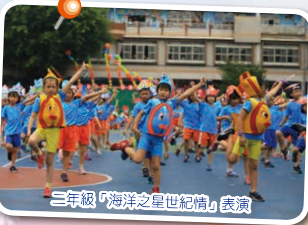
二年級「海洋之星世紀情」表演

Come on! Let's go! 打開歡樂的魔法門扉，螃蟹、企鵝、章魚、海星、熱帶魚……海洋之星出動啦！「Under the sea」二年級小朋友戴著在美勞課自製的閃亮頭套，帶領大家來到蔚藍的民安展開一段充滿魔幻魅力的冒險之旅。「樂讚民安·百年絢麗」沁涼消暑的小雨滴也來湊熱鬧，但澆不熄孩子們奔放的熱情，成就了一場可喜可賀、繽紛精采的海底嘉年華會。