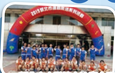
602 新北市大隊接力決賽合照

在新莊區賽中，我們只獲得第三名，按原來的比賽辦法只取前兩名，我們原本以為沒有晉級新北市賽的機會，所以區賽後大家都專心準備期末考，而疏於練習。寒假三天，突然收到老師的通知要集訓，原來是老天爺再給了我們一次逆轉勝的機會！