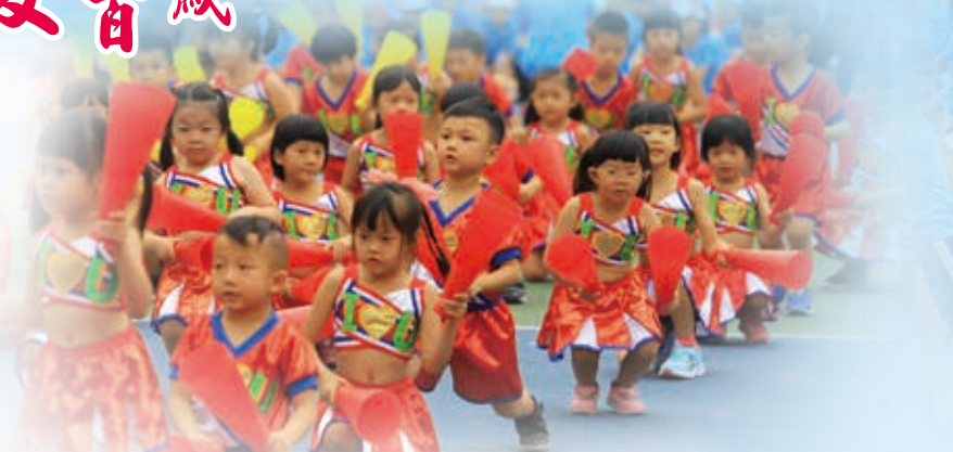
幼兒園「民安好棒響雲霄」表演

活潑又可愛的民安附幼好寶寶，為了民安國小100週年的校慶，準備了精彩又有活力的啦啦隊表演，要跟學校一起慶祝生日。