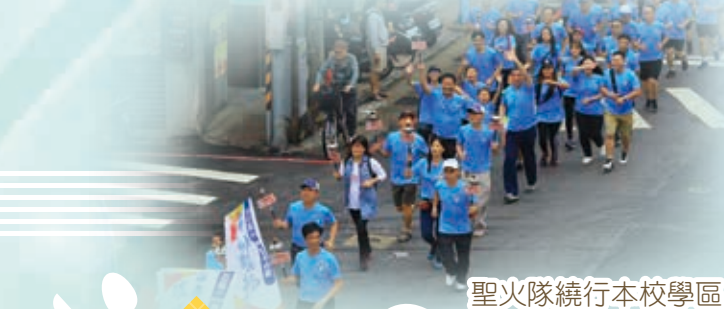
聖火隊繞行本校學區