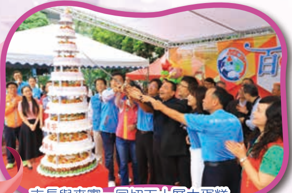
市長與來賓一同切下十層大蛋糕