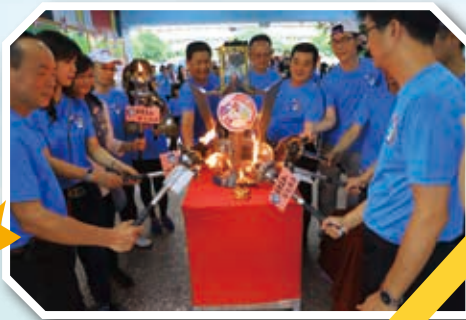
來賓們一同點燃聖火