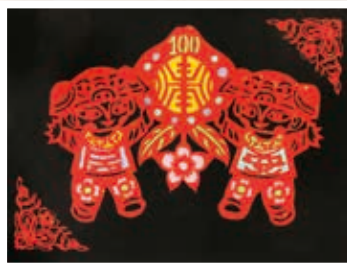
民安慶百年 401 陳筠蓁

期中、期末考的目的是要讓我們複習，要讓我們知道自己還有什麼不懂的地方，還要讓我們懂得更多的知識。我一定要好好努力，下次寫完考卷以後，也要一題一題仔細的檢查，希望能改掉我粗心的毛病。