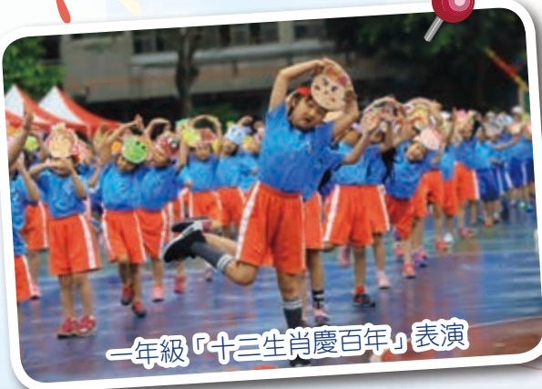
一年級「十二生肖慶百年」表演

可愛的一年級小朋友戴上自製的十二生肖頭套，每個班級代表一種生肖，透過充滿活力的組曲，慶祝民安百年校慶，祝福民安國小積歷史之厚蘊，代代相傳的期盼與教導，願民安宏圖更展！再譜華章！