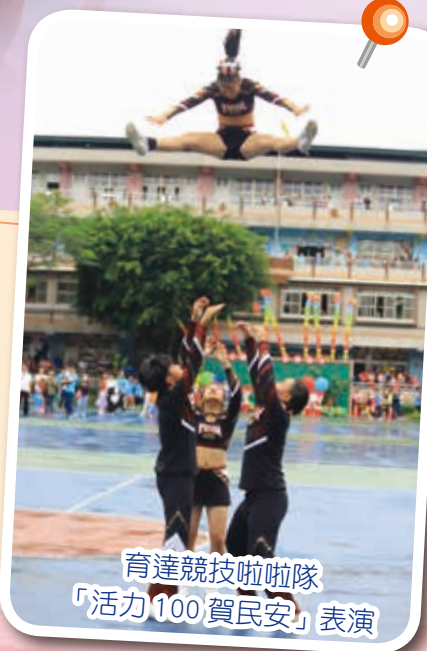
育達競技啦啦隊 「活力100賀民安」表演

育達競技啦啦隊，當日也在校精采亮相，他們結合舞蹈、體操、翻滾技巧、疊金字塔的高難度動作演出，完美全上。在黑白服裝襯托之下，每位選手充分展現出健康、青春、活潑的朝氣。鼓舞人心、提振士氣，秉持「上層是底層的驕傲」這一項精神，為民安百年校慶加油！也期許民安能將百年的精神延續下去。