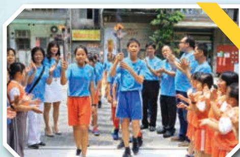
學生列隊歡迎聖火回校