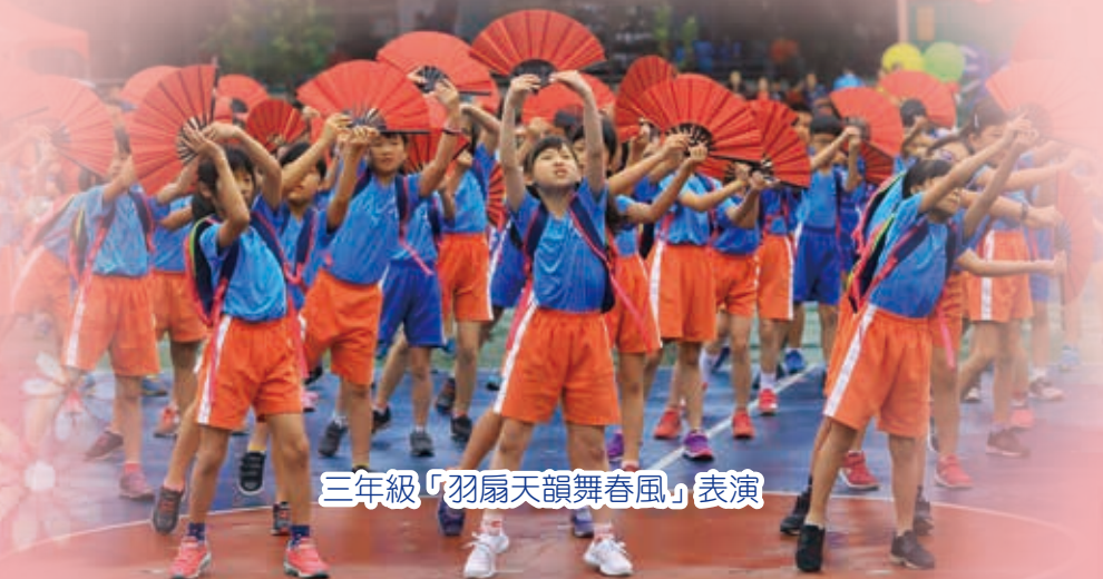
三年級「羽扇天韻舞春風」表演

三年級全體師生以扇子舞獻給學校，慶祝建校百年，也代表著民安國小創校百年，歷經千辛萬苦辦學，不僅孕育出無數人才，在面對任何難題與挑戰時皆能有如孔明揮扇，從容應對。未來，更要以從容的態度迎向下一個百年。祝福新校舍、新氣象、新的心跳、新的民安，生日快樂！