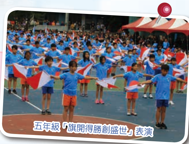
五年級「旗開得勝創盛世」表演

五年級全體學生，在「旗舞震四方，舞蝶驚飛揚」的青春氛圍中，藉由舞動紅白童軍旗，透過輕快振奮的歌曲，曼妙整齊的舞步，在變化萬千的隊形中，展現莘莘學子的力與美、自信與活力，帶給觀眾氣勢磅礴、耳目一新的視覺饗宴，並祝福民安國小「一百歲」生日快樂！