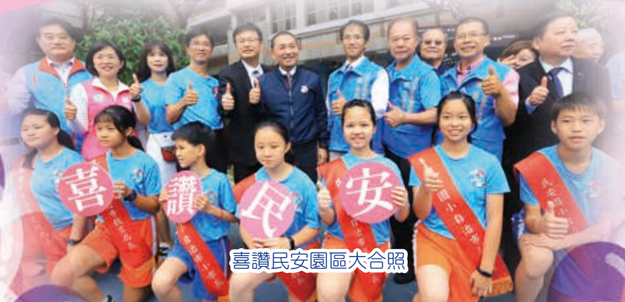
喜讚民安園區大合照