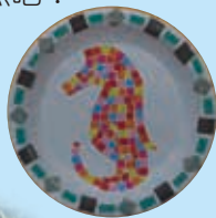
402 林翊君 四年級同學的 馬賽克藝術創作