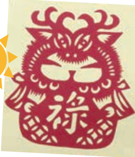
祿娃 -214 董綵涅