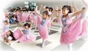
民安藝術角精彩表演

【輔導室訊】2020是驚濤駭浪的一年，我們在新冠病毒的恐懼之中度過，但這無法抹滅我們對於萬物的感謝，以及對於新年的展望與期待。在2020年末，特別舉辦了「聖誕歲末感恩週」，結合「民安藝術角」小藝人快閃表演、尋找校園聖誕老公公雙語闖關活動、故事志工的聖誕故事派、學生不斷電的報佳音等一系列活動，目的就是想要把最殷切的祝福傳遞到每一個人的心中，並傳達學習感恩之心，主動感謝身邊的每一個人。