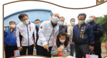
學生以新校園為寫生主題