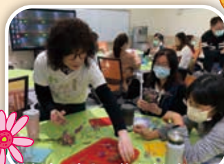
教師專心參與園藝治療知能研習

治療也是自療的歷程，老師們在面對各種不同的狀況時，需要更多支持，在教與學中不斷的成长與進步，用開放與溫暖的心，迎接嶄新的挑戰吧！