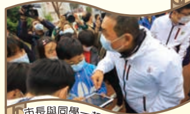
市長與同學一起用ipad檢測水質