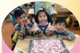
這是我們搓的小湯圓

【幼兒園訊】冬至是一年中很重要的節氣，想到冬至，就想到湯圓，冬至吃湯圓是我國傳統習俗，代表著「一家團圓、圓滿過冬」之意，也意味著吃了湯圓就長大一歲，所以要變得更懂事、聽話！在冬至這一天，除了讓孩子瞭解冬至的由來與意義外，孩子們也實際動手學習搓湯圓，並搭配民安國仔閩語歌謠「冬節圓，拏圓圓……一家團圓，小過年」，帶著孩子感受冬至節慶的氛圍。最後請廚房阿姨協助幫孩子們搓的湯圓加上花生仁煮好，全園一同開心享用自己搓的熱呼呼又好吃的湯圓，冬至吃湯圓，祝福大家圓圓滿滿！