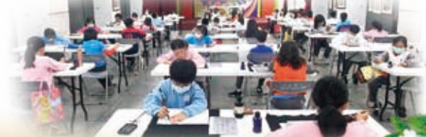
校內語文競賽，寫字比賽現場

【教務處訊】一年一度的校內語文競賽於 12/9 及 12/16 辦理完畢。本次三至五年級動靜態組選手共 256 人次參賽，由三至五年級導師指導選手及擔任評審，教務處夥伴、一二年級老師及科任老師擔任工作人員，六年級出借教室做為比賽場地，可以說是全校老師總動員，同心協力為學生們準備賽事，班級總成績前三名分別是：三年級 303、304、312；四年級 408、405、406；五年級 506、510、502。