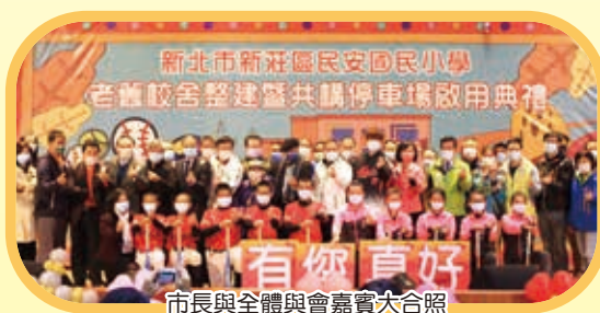
市長與全體與會嘉賓大合照