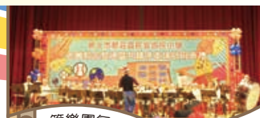
管樂團氣勢磅礴的開場演出

新的校舍（忠孝樓）為地上四層教學大樓含40間教室、一棟地上三層體育館，以及地下室二層共構交通局停車場。新建校舍啟用之後，學校擁有設備完善的教學教室、200多人的視聽教室、永續多樣性的生態池教學區、以及可容納2000人的多功能體育館（能強館）、智慧教室。未來還會增設「新北市藝術STEAM創發中心」、新北市版畫教育推廣中心，讓教育與校務有更前瞻的經營與發展。民安國小未來除提供學生有更多元的學習舞臺外，也將是活絡學子及社區民眾學習與休閒生活的友善校園。