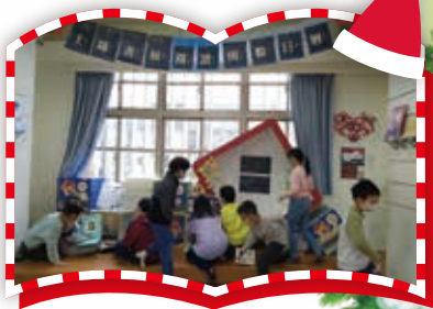
主題書展閱讀倒數日曆