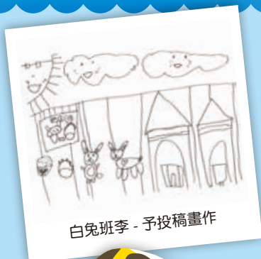
白兔班李 - 予投稿畫作

我說大海是地球的母親 她蘊育了豐富多樣的生物 讓世界變得更精采美麗 我們應該要珍惜她、愛護她