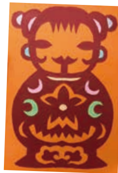
喜娃 -206 黃子旂

如果我是海神， 我要用神奇的三叉戟， 把大海變乾淨， 還給海底生物一個舒服的家。