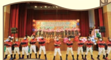
體育班震撼人心的勝利戰呼