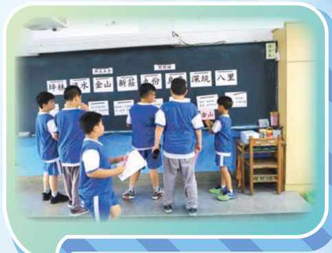
藝巧饗美食 - 來去家鄉吃美食

除了祝福孩子們兒童節快樂外，「寓教於樂」老師們也期盼藉由此次不同於紙筆測驗的活動方式，讓孩子們更熟悉平日各領域所學的知識與技能，並透過實際的操作與演練，瞭解如何以健康、安全的方式參與活動及防災教育。此外，更希望能藉此訓練孩子們的手眼協調與肌耐力，並從中培養孩子們良好的學習態度，並且快樂學習！