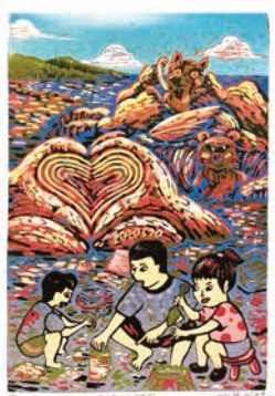
特優 609 張欣婕 幸福沙雕節