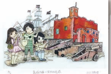
特優 408 王筠煊 舊城故事—淡水紅毛城