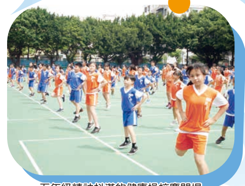
五年級精神抖滿的健康操校慶開場

「臺上一分鐘，臺下十年功」，回想起那無數個在豔陽高照下，辛勤地揮汗如雨練習健康操的日子，現在已化成甜美的喜悅。看著場上的孩子，跟著活潑有朝氣的音樂擺動身體，盡情揮灑熱情的汗水，那自信、認真的表情和整齊一致的動作，讓我再也掩不住心中激動的情緒，我想要大聲地對孩子們說，「你們是最棒的！」