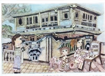
特優 406 黃澗嫻 刻畫林家花園