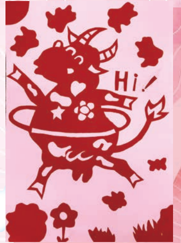
Hi 牛 -206 羅右芸

白，真好 白是一個團結的孩子 他們成群結隊走到紙張裡 讓人們用到白紙 他飛到天上 讓雲朵變白 他躺進油漆裡 讓牆壁煥然一新 白 雖然亂跑亂跳 但是 大家都喜歡他