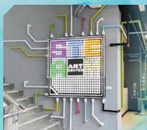
◀ 新北市藝術 STEAM 創發中心