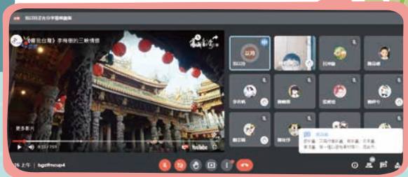
老師線上教學直播畫面

【教務處訊】因應疫情爆發，為了守護大家的安全，全國停止到校上課。儘管如此，老師們仍秉持「停課不停學」的精神，透過網路的視訊直播、互動平臺或自製影片等方式設計多元課程。在學習的同時，也兼顧學生的用眼健康與學習品質。此外，也因為每位學生的配合與家長的協助，才能達成「學習零時差」的目標。讓我們大家繼續努力，共同度過這段艱難時期。