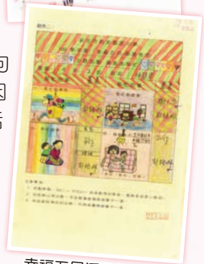
幸福五月活動學習單