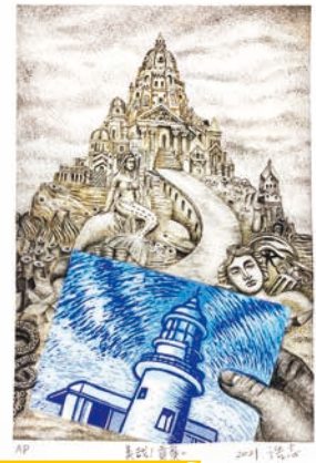
特優 洪詰志 美哉！貢寮