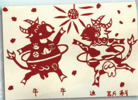
牛牛迪斯科 606 邱湏禎