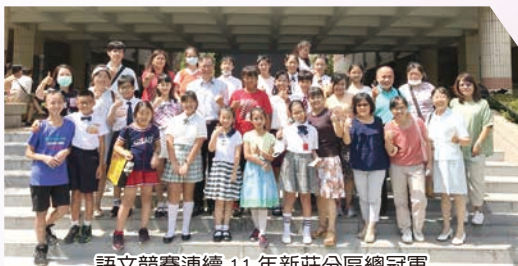
語文競賽連續 11 年新莊分區總冠軍