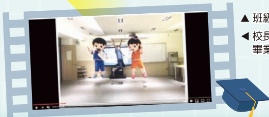
◀ 校長頒發畢業證書