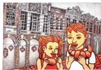
特優 509 鄭淨心 古老的三峽老街