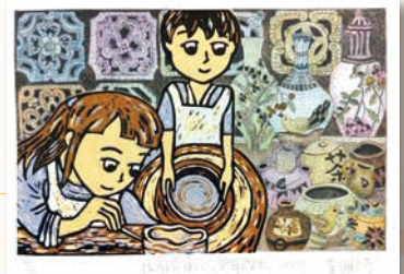
特優 404 李珮綺 我喜歡的鶯歌文化