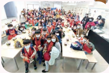
稚齡童軍校外教學大合照

【幼兒園訊】稚齡童軍校外探索活動又來囉！這次我們來到了土城區「王鼎時間科藝體驗館」進行體驗與參訪。分組進行導覽，透過現場專業人員詳細的介紹館場區域，有鐘錶精品區、時間探索區、品牌簡介區、石英原理區、鐘錶知識區及體驗教室區，這六大區讓狼寶寶瞭解到什麼是時間？手錶是如何製作出來的？石英鐘錶運作原理和古人如何看時間及時鐘究竟如何演進的呢？提供了狼寶寶學習關於時間的相關概念知識。最後，狼寶寶們到體驗教室區大展身手、發揮創意，在聽完如何組裝石英鐘機芯零件後，每位狼寶寶DIY設計時鐘剪貼外殼，製作出獨一無二的個人小時鐘。期許藉由這次的稚齡童軍校外活動，培養孩子的守時觀念、認真負責的態度並遵守團體規範。