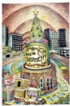
特優 509 王巧湘 歡樂耶誕城