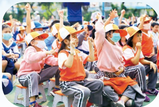
一年級總是熱情的參與各項校園活動

下學期持續以創新的思維，進行奇幻教學旅程，學生依然充滿著高昂學習興致，又歷經了校慶活動、學年趣味競賽，豈料，新冠疫情不僅不放棄攪局，更變本加厲，不斷的向我們逼近，情勢可說是越來越險峻，但是，民安優秀的導師們依然面不改色的以從容之態度，配合新潮校長的帶領，讓學校迅速進入謹慎且滴水不露的防疫備戰狀態，也使得導師們能以前所未有的線上方式，持續進行有系統的教學活動，依然帶領著學生繼續一系列的啟發與學習，將使得這群新生們不僅知識收穫滿滿，整體表現將可預期，必定脫胎換骨，且全面昇華，勢必以嶄新的面貌直接升級二年級，敬請大家拭目以待，隨著我們一年級，一起升級去。