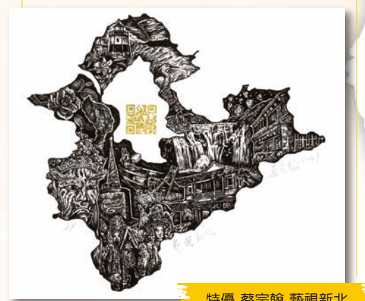
特優 蔡宗翰 藝視新北