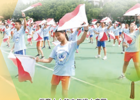
振奮人心的六年級大會舞

如同我們表演的歌曲中所言：「拳頭只能讓人低頭，念頭卻能讓人抬頭，抬頭去看去愛，去追你心中的夢。」願全體六年級的畢業生，面對未來人生的一切困難和挑戰，都能用正向積極的念頭去面對，同時懂得愛自己、愛他人並勇於追求心中的夢。願你們在日後的各項人生征戰中，都能旗開得勝！