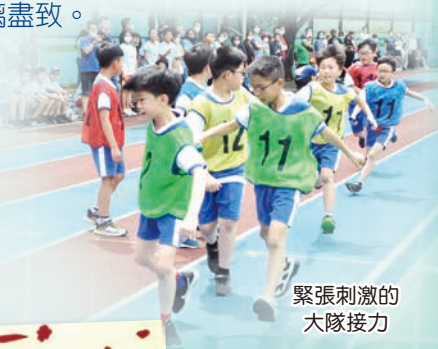
緊張刺激的大隊接力

面對嚴峻疫情的當下，希望大家在適當的空間與時間中，多多運動增加抵抗力抵抗頑強的病毒，一起為防守疫情，做好充足準備。