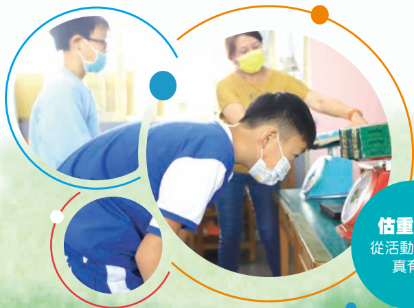
估重快手 從活動中學習 真有趣

終於完成闖關活動了，學生們興奮的把自己的闖關卡投進校長室前的摸彩箱，準備迎來第二波的驚喜，看看誰最幸運，可以獲得大獎呢？此時，校園裡到處充滿歡樂的氣氛，為我們的學生們慶祝著專屬於他們的節日—兒童節快樂。