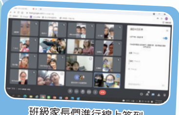
班級家長們進行線上簽到