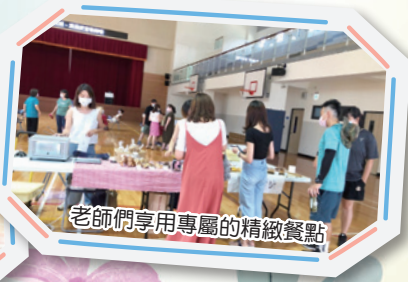
老師們享用專屬的精緻餐點