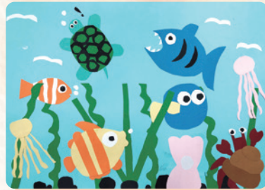
海底世界 -314 董綵滢

沒有一個人可以單獨生活在這群居社會，要懂得去關懷他人，彼此互相幫助。愛就好像冬天裡的一杯熱可可，讓人感到溫暖；也像夏天裡的一陣涼風，讓人感到涼爽。就像現在疫情當前，正因有了愛，大家互助，世界才會變得更加美好，讓我們一起，把愛給傳出去吧！