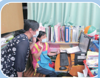
幼兒園主任和大家打招呼

今年因應疫情關係，第一次進行線上家長日，各班老師用心的讓家長事先瞭解操作的方式，讓線上家長日能順利的進行。活動中，欣賞校長及會長致詞影片、播放幼兒園PPT和影片欣賞，家長們更清楚園務的運作及相關的活動，接著各班介紹班級經營及課程的分享，最後則是Q&A時間。老師、家長及孩子們在線上相聚都很開心，家長日順利圓滿結束。