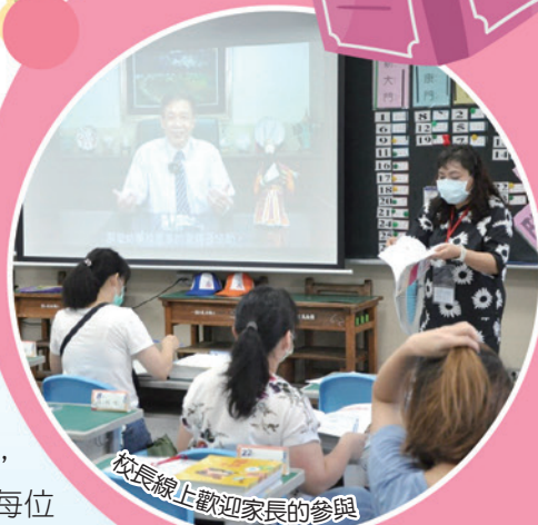
校長線上歡迎家長的參與

這是一年級新生進入校園、學習獨立的新契機，雖然因為疫情，讓活動有些被侷限，但相信在老師、家長的陪同下，每位學生在未來的日子裡，都將擁有珍貴且難忘的國小生活。