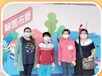
國語字音字形指導老師和選手