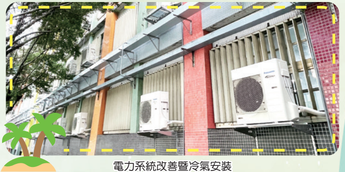
電力系統改善暨冷氣安裝

【總務處訊】氣候變遷，使得夏天變得酷熱又漫長，即使教室內電扇開到最大，增加立扇的馬力，還是像在烤箱似的悶熱，真的很難靜下心來上課。小朋友的心聲，我們都聽見了！今年8月開始展開電力系統改善暨冷氣裝設工程，目前電力系統改善的工程正如火如荼地進行，線槽及教室配電箱也已安裝完成。緊接著便是配置高低壓配電箱位置的開挖，之後等電纜線到貨拉電，工程就接近尾聲了。冷氣機的部分，每間教室會安裝兩台8KW的國際牌分離式冷氣機，加大的噸數完全不怕教室西曬問題。總務處要特別感謝施作廠商配合將施工時間移至下午1點至晚上10點施作，以減少影響學生上課時間，也感謝校內老師、學生的配合，讓工程能順利進行。工期預計到111年3月竣工，讓我們一同期待明年夏天涼爽舒適的上課天吧！