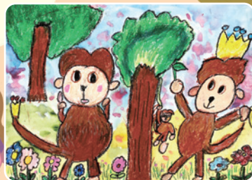
頑皮的猴子 105 林威宇