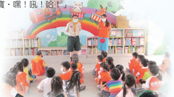
校長和狼寶寶打招呼

因應疫情防疫，第一次的稚齡團集會在10月份開團了；校長也一起參與活動。集合點名時，服務員幫大家確實量體溫，落實狼寶寶的諾言「我愛自己，我愛大家」！接著大家一起玩猜拳長葉子的遊戲，最後再一起練習團呼吼聲「狼寶寶：嘿！狼寶寶·吼！狼寶寶·狼寶寶·嘿！吼！哈！」