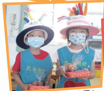
小壽星領紅蛋和禮物囉！

在幼兒園孩子們最期待的活動之一，就是每個月的慶生會。今年因新型冠狀病毒疫情影響，原本的全園慶生活動改在班級教室慶祝，小壽星接受班上大家誠摯的祝福與慶賀。過生日吃紅蛋是有講究的，先把雞蛋在身上滾一下，這樣能帶來福氣，滾完之後把雞蛋在頭上敲一下，叫“開竅”，如果一次就能磕開，說明這個人聰明；剝蛋殼代表剝開過去、脫胎換骨，意味著剝殼重生的開始。祝福每位民安附幼的小壽星，許下的願望必能實現，且都有個快樂又特別的生日回憶！