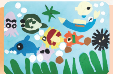
水中樂悠游 -203 詹丞睿