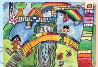
美麗的校園 105 陳亭安

從疫情之初，政府不斷宣導戴口罩、勤洗手可以打擊病毒。每天中午用餐前，學校都會廣播，吃飯前正確洗手五步驟「濕、搓、沖、捧、擦」及「內、外、夾、弓、大、立、腕」七字訣，以防腸病毒及COVID-19的入侵，有效預防傳染病，用餐安心又安全。我覺得從三級警戒降到二級警戒，就是因為大家都有認真遵守防疫的規定，勤洗手、戴口罩，保持社交距離，保護他人也保護自己。在降級之際，我們仍然不可掉以輕心而鬆懈喔！