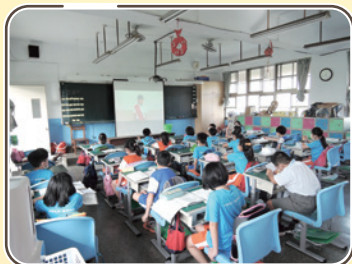
觀賞政見發表影片

疫情陰霾下，全校師生展現了民主精神，推選出自治市政團隊。本屆自治市將在眾多學生寄予厚望下推展各式學生事務，實踐為公眾服務的學習精神。