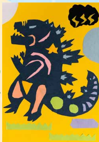
恐龍 -505 李昊澄

突如其來的疫情，若有被通知居隔，關在家中好傷心，如果陽性別隱瞞，打亂我們的生活，莫慌莫急莫害怕，想見朋友卻不能，否則荷包會不保，餐飲業被迫關門，居家七天就完事，整間房間空蕩蕩，經過這次的隔離，就怕病毒找上門，保護你也保護我，裡面只有我一人，了解防疫的重要，出門酒精不離身，在家經常吃泡麵，翻來覆去好無聊，身邊處處都危險，隨時隨地都消毒，味覺都快沒感覺，望向窗外想大叫，大家防護要確實，萬能口罩要戴好，想念外頭的世界。最後還是忍下來，病毒全都快快走！不然醫生找上你。就怕被當神經病。快、快、走！