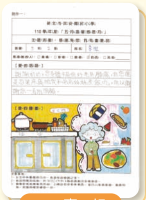
602 李 虹