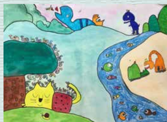
動物樂園 -401 曾云彤