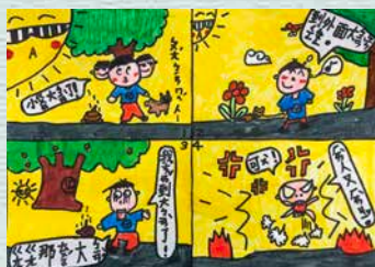
公德心 -205 江凱耀

經由這次參觀福營行政中心，讓我更了解行政中心的功能以及服務項目。我們不只參觀福營行政中心，還認識周圍的社區與學校圍牆壁畫，我覺得老師安排參觀福營行政中心的活動很棒，以後無論是借書，或是辦理身分證，都可以好好利用。