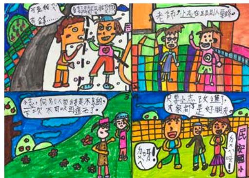
迷途知返 -205 陳亭安

這次的海科館之旅讓我流連忘返，因為我在那裡學習到了許多關於海濱植物、螺槳、飛翼船、貝類和巨口鯊的知識。所以下次有機會，我一定會再來一次！