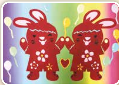
好友兔 -406 羅右芸