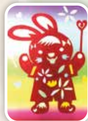
魔法兔 -214 陳品瑄