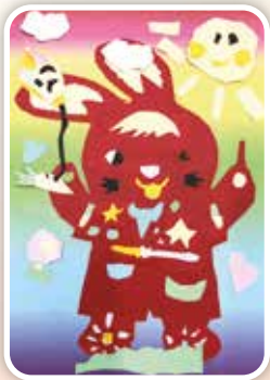
可愛兔 -205 林億雯

我是一隻聰明的花豹， 美麗的花紋讓我很驕傲， 健壯的腿可以飛快的跑。 抓到美味的獵物就掛樹梢， 這樣別的動物就搶不到！ 當別人欺負我的小孩我就吼叫！ 絕對會保護我最愛的寶寶！