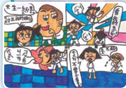
性別平等 -205 郭卉芯

不論是男孩還是女孩，都應該尊重自己的感受，適時的求救，保護自己。希望每一位小朋友都能夠學習保護好自己，快樂健康的成長！