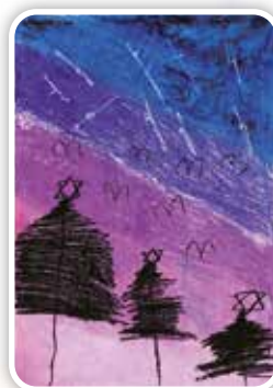
104 曾芷潑漸層的天空