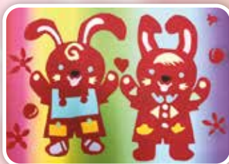
快樂兔 -309 康于恩

我覺得我的家人都是我最好的夥伴，不論在我開心或難過時，我都會想跟我的家人分享，因為他們是我最大的依靠。